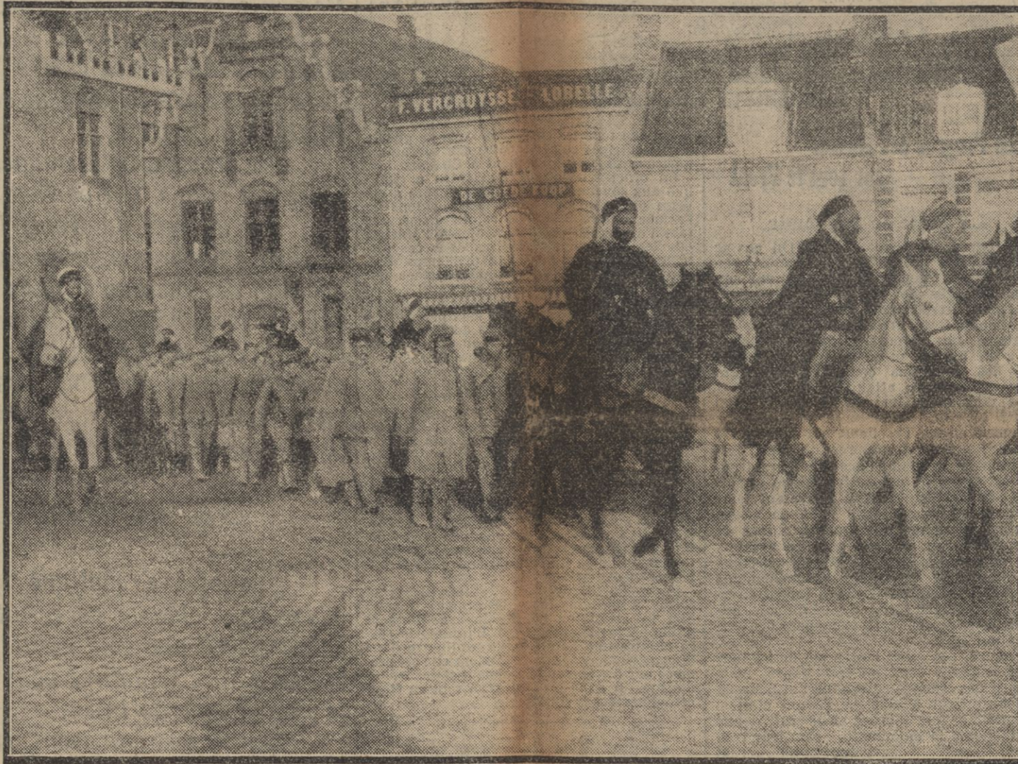
DES SPANIS MAROQUAINS ESCORTENT UN NOMBREUX CONVOI DE SOLDATS ALLEMANDS CAPTURES PENDANT LA BATAILLE DES FLANDRES