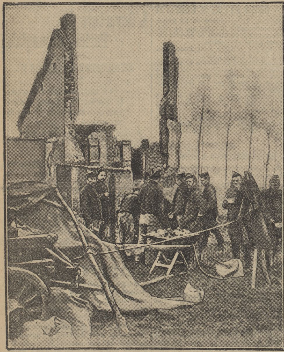
Soldats belges du régiment des guides campés devant une maison en ruines.