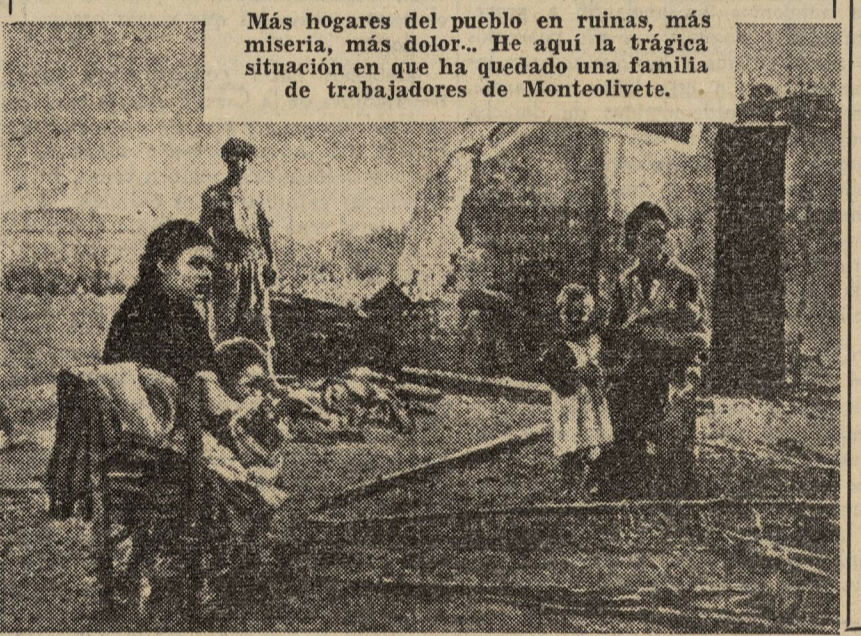
Más hogares del pueblo en ruinas, más miseria, más dolor. He aquí la trágica situación en que ha quedado una familia de trabajadores de Monteolivete.