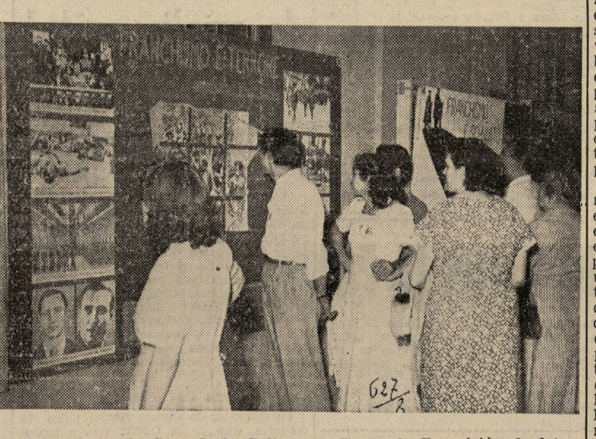
Inaugurada en la Casa de la Cultura de Roma, la Exposición de fotografías y documentos sobre la lucha del pueblo español recorre las principales ciudades de Italia. Nuestra foto reproduce un aspecto de dicha exposición momentos después de ser abierta al público durante la grandiosa fiesta organizada por nuestro fraternal colega «L'Unità» en Florencia. (Información en la pág. 2)