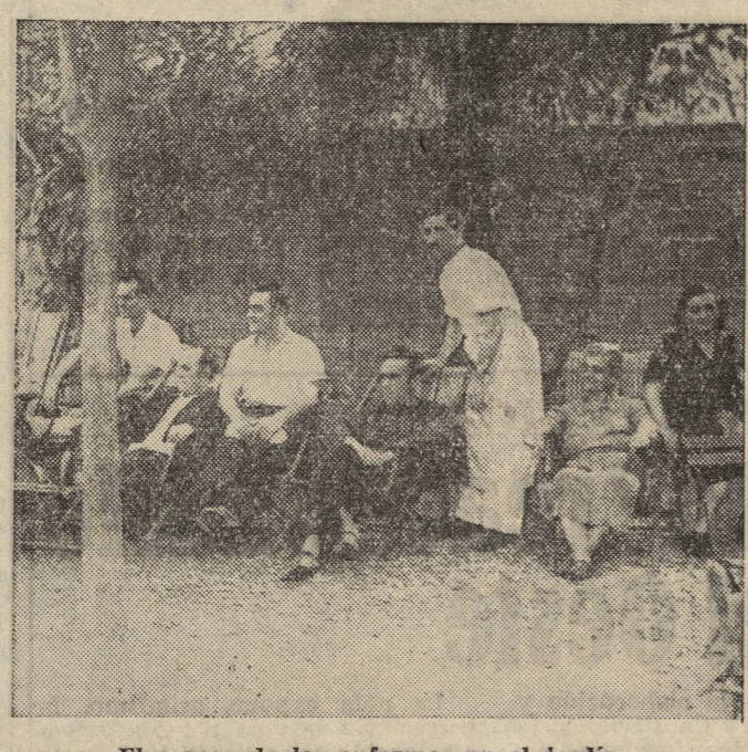
El reposo de los enfermos en el jardín.

Parece un libro de contabilidad, uno de esos libros de oficina donde se da por descontado que no habremos de encontrar nada que esté vivo, nada que tenga calor humano. Pero no es así. El libro lleva un título: «El enfermo y el hospital» y en sus páginas están las huellas de las vidas que han pasado por aquí.