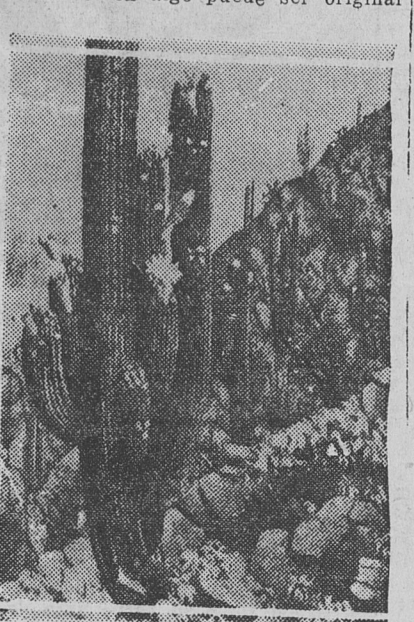
"CARDONES FLORIDOS", óleo por Luis Landi.

En "Camuati", Chacabuco 329, se acaba de inaugurar una muestra del pintor rioplatense Luis Landi, que tiene como único motivo temas de esta remota región argentina. Este solo enunciado tiene ya un valor en nuestro medio. Si en algo puede ser original