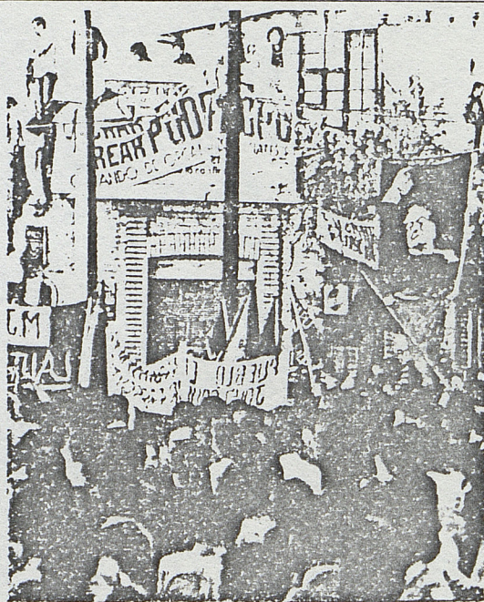
CHILE : Manifestación

El F.A.R.C. y todo el equipo que trabaja en TELEX-CHILE, saluda revolucionariamente en este nuevo año a nuestro pueblo chileno, a los obreros, campesinos, mujeres, a la juventud, a los estudiantes, a los presos políticos y relegados, a todos aquéllos que son oprimidos por la dictadura militar.