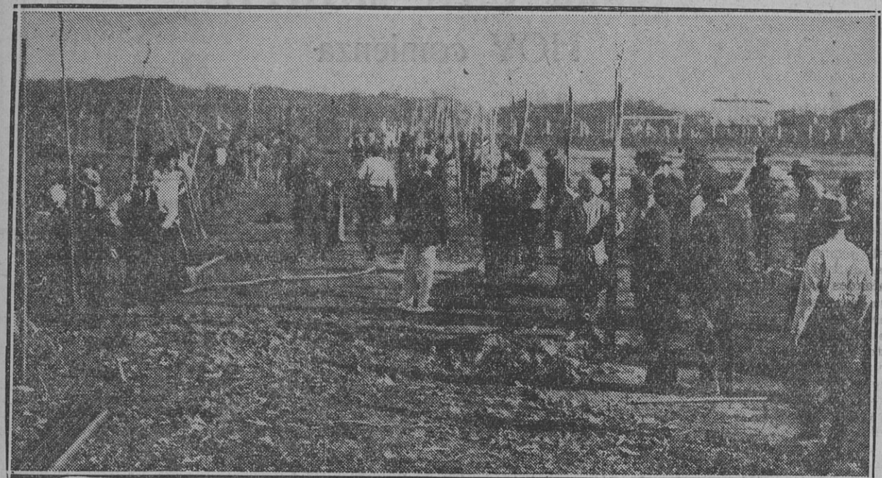
UNO DE LOS ASPECTOS DEL CAMPO DE DEPORTES, AL INICIARSE LA PLANTACION.

En esta tarea participaron no solamente los asociados, sino también sus esposas e hijos. En premio al esfuerzo realizado y mientras la poderosa orfónica desarrollaba una nutrida y selecta audición musical, sirvióse un almuerzo exclusivamente destinado a los participantes de la plantación, que repararon con creces las pérdidas energías.