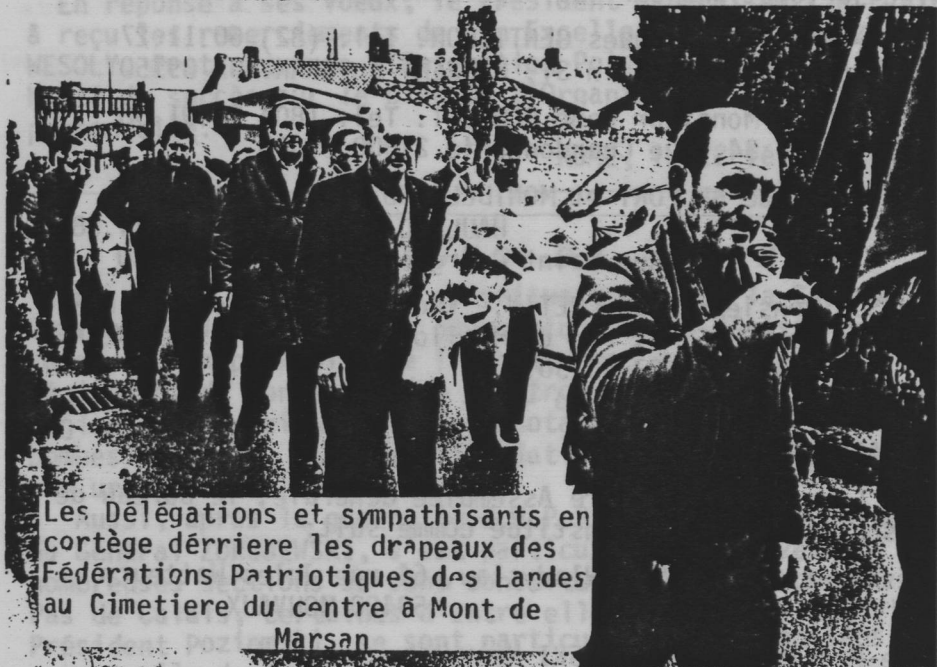
Les Délégués et sympathisants en cortège derrière les drapeaux des Fédérations Patriotiques des Landes au Cimetière du centre à Mont de Marsan