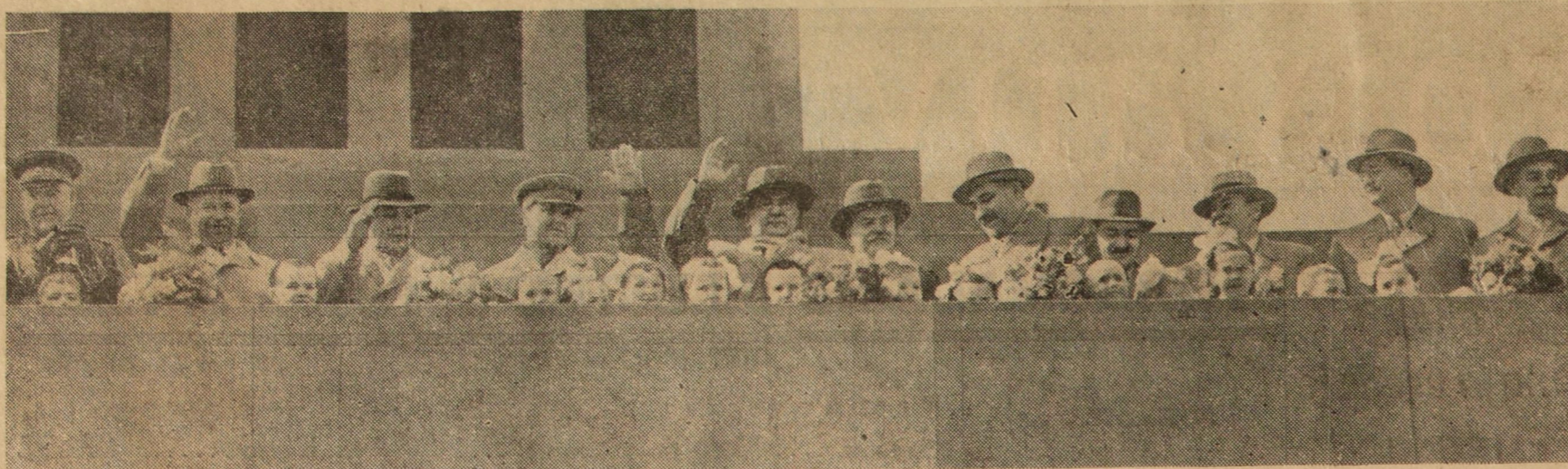
Dorocznym zwyczajem święto Pierwszomajowe w Moskwie obchodzone było uroczystie. Otrzymała defilada, w której wśród lasu sztandarów i chorągwi niesiono portrety zasłużonych mężów stanu, (na jednym widzimy sekretarza generalnego KPF, Thoreza) odebrało prezydium Zw. Radzieckiego w osobach: Od lewej: A. Bulgani- na, C. Chruszczewa, E. Woroszyłowa, J. Malenkowa, P. Berii, W. Mołotowa, M. Kaganowicza, I. Mikołajana, E. Saburowa, G. Perwuchina i M. Szwernika. Wraz z kierownikami Partii i Rządu widzimy na zdjęciu dzieci, które przyniosły im kwiaty.