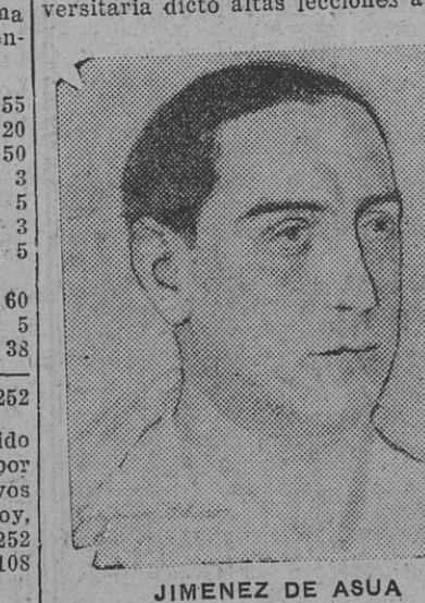
JIMÉNEZ DE ASÚA

El sabio profesor español doctor Luis Jiménez de Asúa, cuya fecunda y renovadora labor intelectual se aprecia en nuestros días, al que ha visitado varias veces y desde cuya cátedra universitaria dictó altas lecciones a la ju-