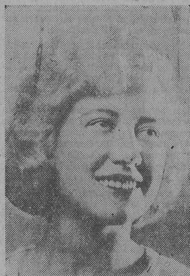
PRIMERA ACTRIZ DEL ELENCO a presentarse próximamente en el teatro Argentino