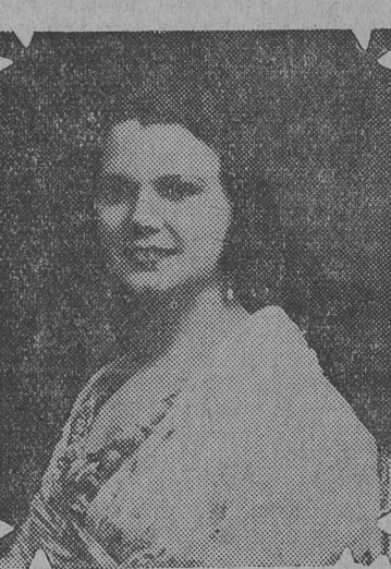
PRIMERA FIGURA FEMENINA de la compañía García León-Perales, que se presentará esta noche en el teatro Apolo