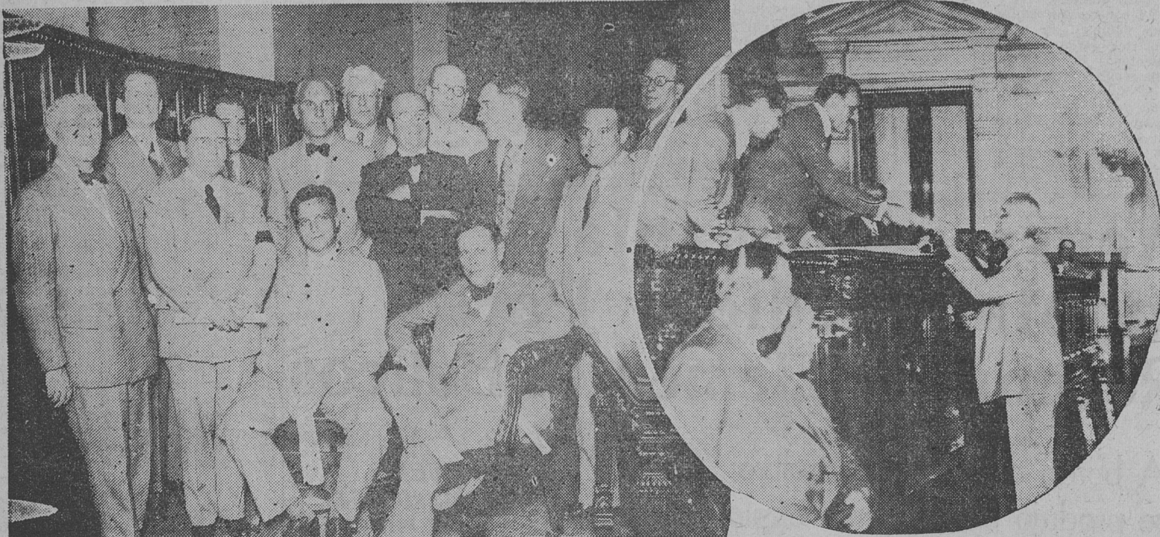
Grupo de diputados y concejales socialistas electos. — En círculo: Entrega de los diplomas.

Los candidatos socialistas electos diputados y concejales fueron saludados con nutridos aplausos, tanto al recibir sus diplomas como al hacer abandono del congreso.