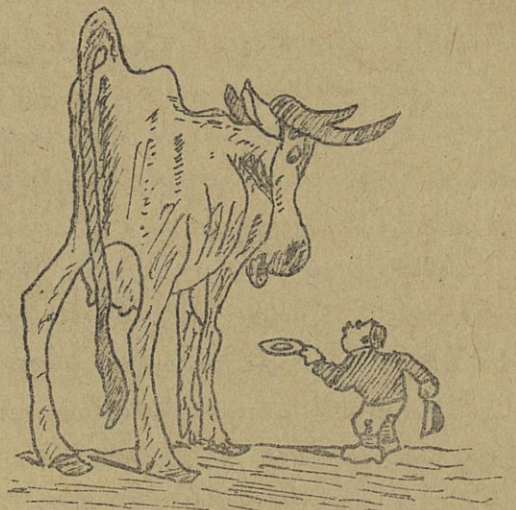
- Kunt u my misschien een half pond boter verkoopen.