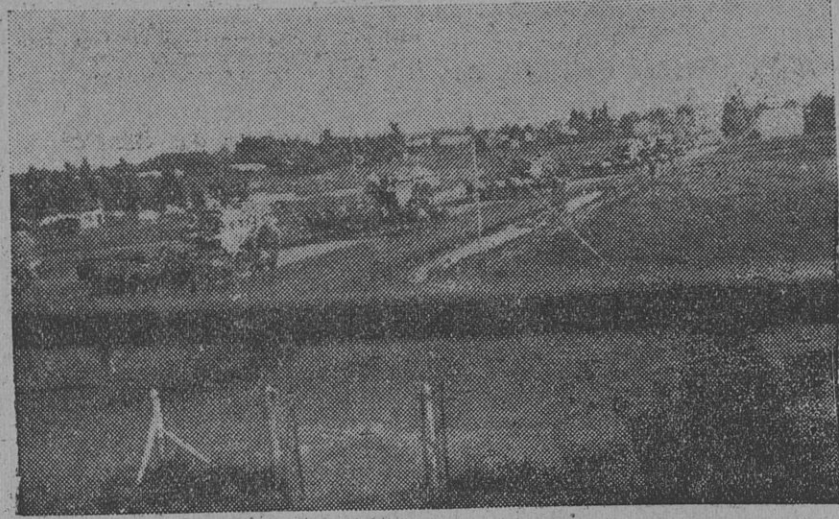
El camino entre Necochea y La Dulce, actualmente de tierra, soporta un tráfico intenso, ya que sirve a importantes zonas agrícolas, que resultarían beneficiadas con la pavimentación. El grabado muestra la caravana interminable de carros, transportando cereales.

Pues bien, esta Cooperativa Agrícola La Dulce, entiende que con el trazado que en el plan caminero, recientemente sancionado por ese poder ejecutivo, se asigna para la zona de Necochea, nos encontramos frente a un ca-