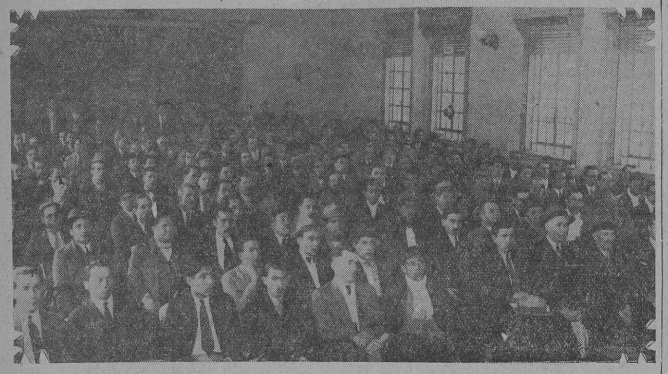
VISTA DE LA CONCURRENCIA QUE ASISTIO AL ACTO CELEBRADO POR LA SOCIEDAD DE OBREROS PANADEROS

puede concebir cómo se ha llegado en este asunto a extremos tan graves y denigrantes para la propia autoridad, menoscabada por la subversiva conducta de los dueños de panaderías. EL ACTO DE AYER Cumpliendo, pues, esos propósitos de plantear ante la opinión pública este problema, realizóse ayer, con todo