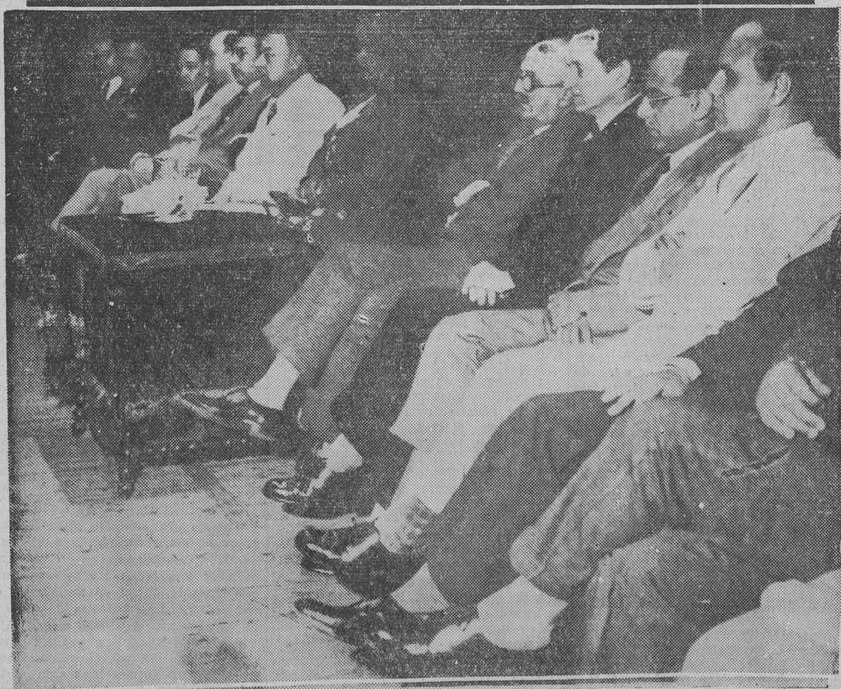
LOS ORADORES DEL ACTO E INVITADOS ESPECIALES

Señores: Pude seguir de cerca la gran reforma educacional austriaca, estructurada en una profunda cultura, en nuevas concepciones sociales y en una aspiración ideal, llevada a cabo en