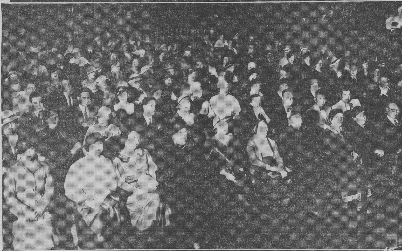
PARTE DEL PUBLICO QUE ASISTIO A LA APERTURA DEL CONGRESO

Escuche todos los días, por L. R. 10, Radio Cultura, el Boletín Radiotelefónico de "La Vanguardia", que se propala a las 18.45 horas.