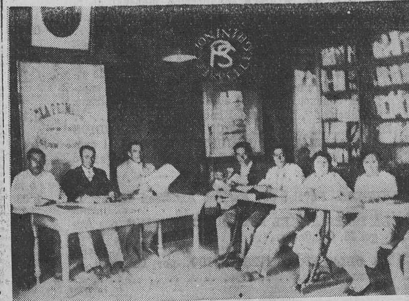
AFILIADOS DEL CENTRO DE PELLEGRINI Y LECTORES EN la Biblioteca Popular "Juan Bautista Alberdi"

Sin excepción en este sitio se reúnen los hombres más desinteresados y mejor intencionados de cada pueblo; los problemas de la miseria, del abandono de los campos, del gobierno comunal, estos hombres reunidos entre estas cuatro paredes bajo este techo, los contemplan y los tratan con un alto y desinteresado espíritu humano, y si no los resuelven en bien de todos,