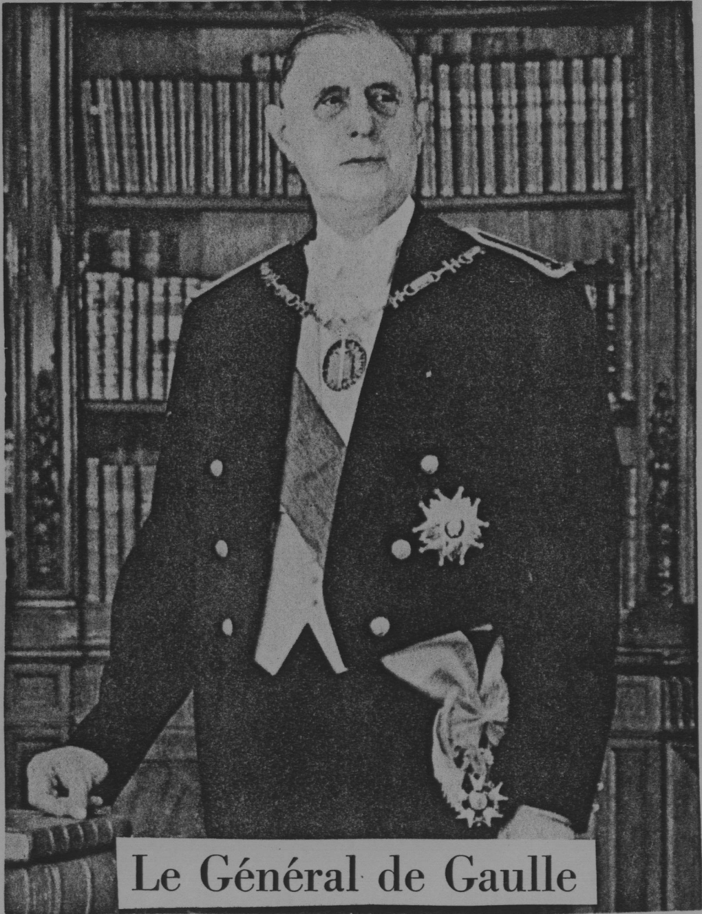
Le Général de Gaulle