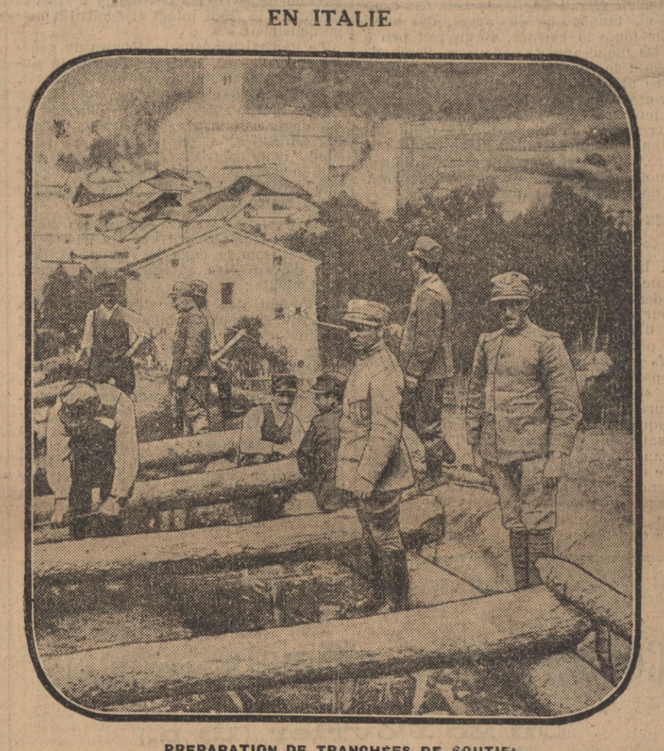
PREPARATION DE TRANCHÉES DE SOUTIEN

Après une nuit un peu plus calme, le bombardement ennemi reprendit le matin avec une violence inouïe des deux rives de la Meuse. Sur nos tranchées de première ligne, c'était un tonnerre assourdissant d'un mélange de coups de canon et de coups de mitrailleuse.