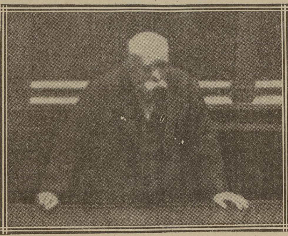
M. CLEMENCEAU PENDANT SON DISCOURS D'HIER

« Je suis en mesure de dire que nous comptons d'une manière ferme sur l'adoption du traité à-bas. Et c'est peut-être par un excès de crainte de voir ébranlés les premiers échafaudages de l'édifice que nous avons, hier, échangé des observations un peu vives. Notre désir ardent est que la Société des Nations réussisse, et si nous pouvions aider M. le président Wilson, comment que ce fut, nous serions les premiers à accuser ce que je peux dire, c'est que si les hommes