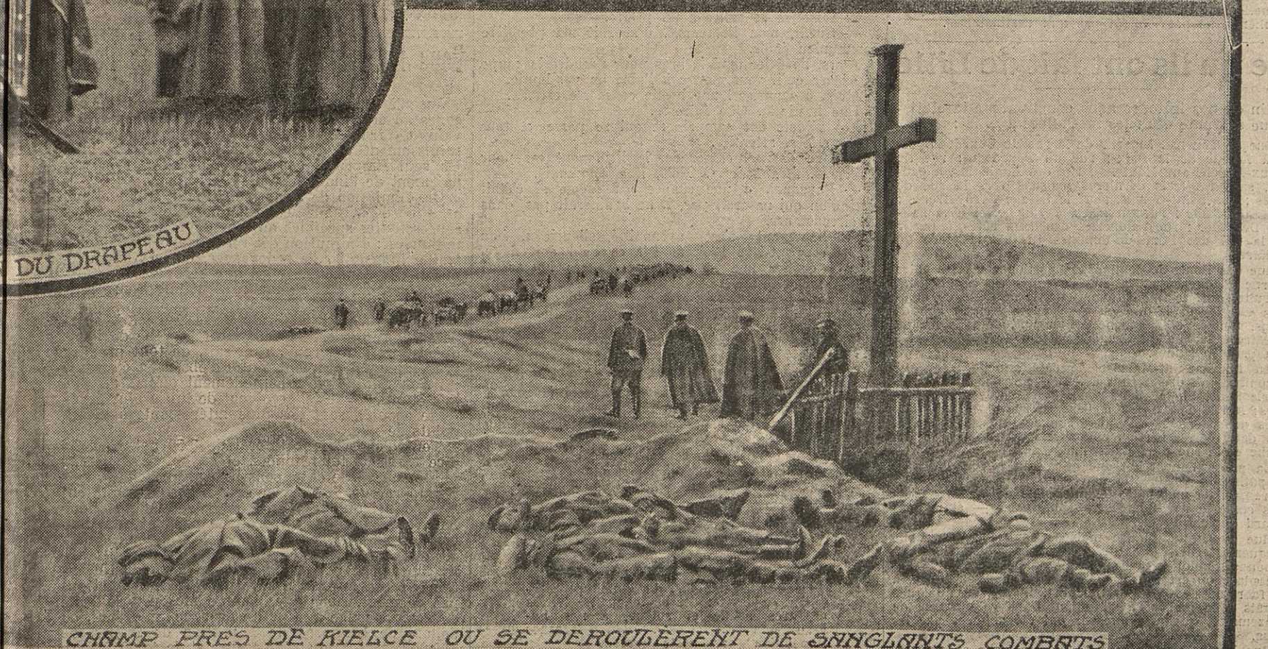
CHAMP PRES DE KIELCE OU SE DEROULERENT DE SANGLANTS COMBATS

Sur la rive gauche de la Vistule, en Pologne russe, l'accalmie, depuis quelques jours, est générale. Elle ne serait pourtant que momentanée ; le général von Hindenburg aurait, en effet, reçu des renforts et préparerait une nouvelle attaque vers Varsovie. Pendant ce temps, les Russes poursuivent les Autrichiens qu'ils ont battus en Galicie, ils s'avancent en Bukovine vers la Transylvanie et font essayer de nouvelles défaites à l'ennemi.