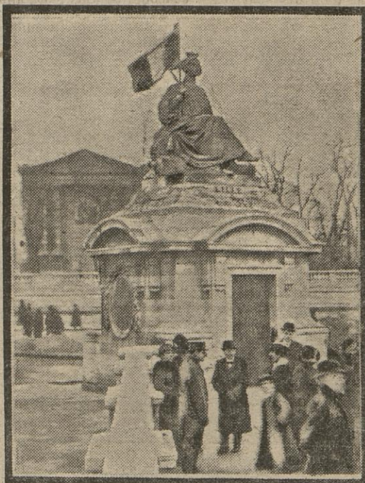
Lille est encore sous la domination allemande. Mais pas pour longtemps : c'est ce qu'ont voulu marquer, hier, des patriotes qui se sont rendus en groupe place de la Concorde et ont orné la statue d'un drapeau tricolore.