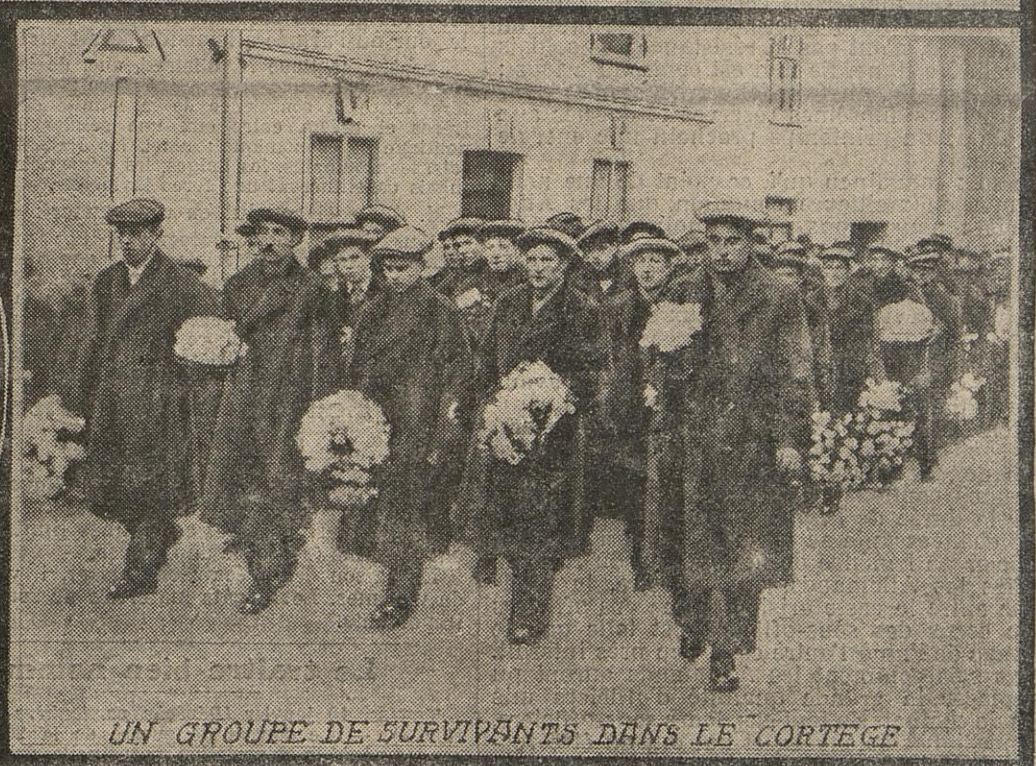
UN GROUPE DE SURVIVANTS DANS LE CORTEGE

Ainsi que nous l'avons annoncé, le cuirassé anglais Formidable , torpillé par un sous-marin allemand, coula dans le « channel » il y a quelques jours. Plusieurs centaines de marins faisant partie de l'équipage de cette unité de guerre périrent dans cette catastrophe. D'imposantes funérailles viennent d'être faites à quelques-uns de ces braves dont on a pu repêcher les corps.