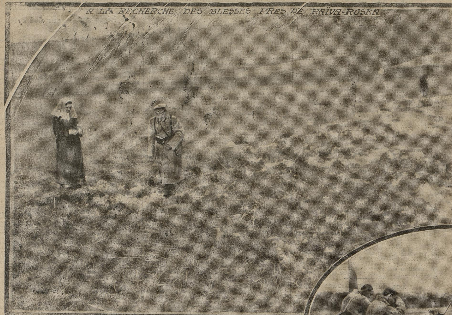
A LA RECHERCHE DES BLESSES PRES DE RAINA-RUSKA