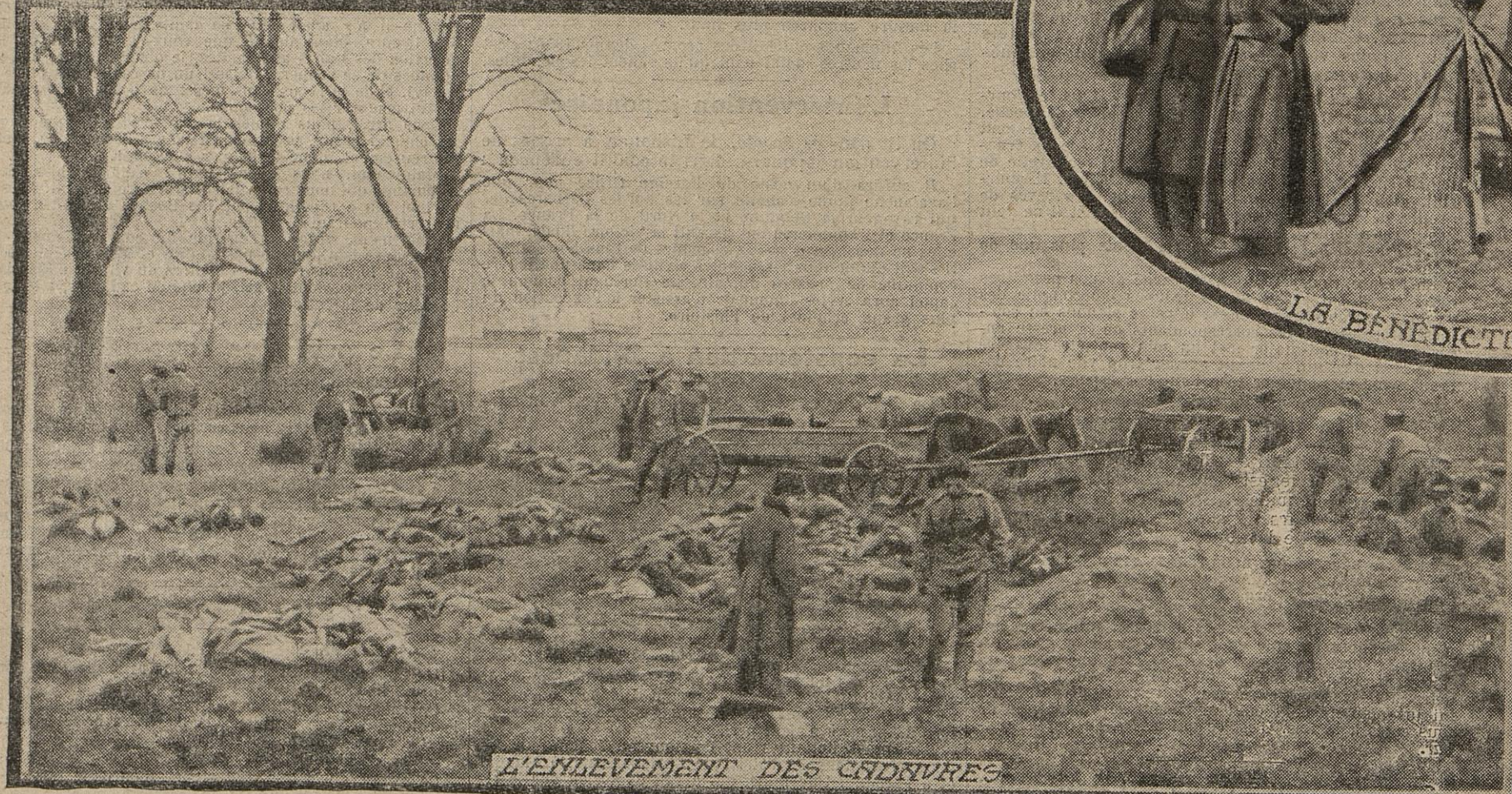
L'ENLEVEMENT DES CADAVRES