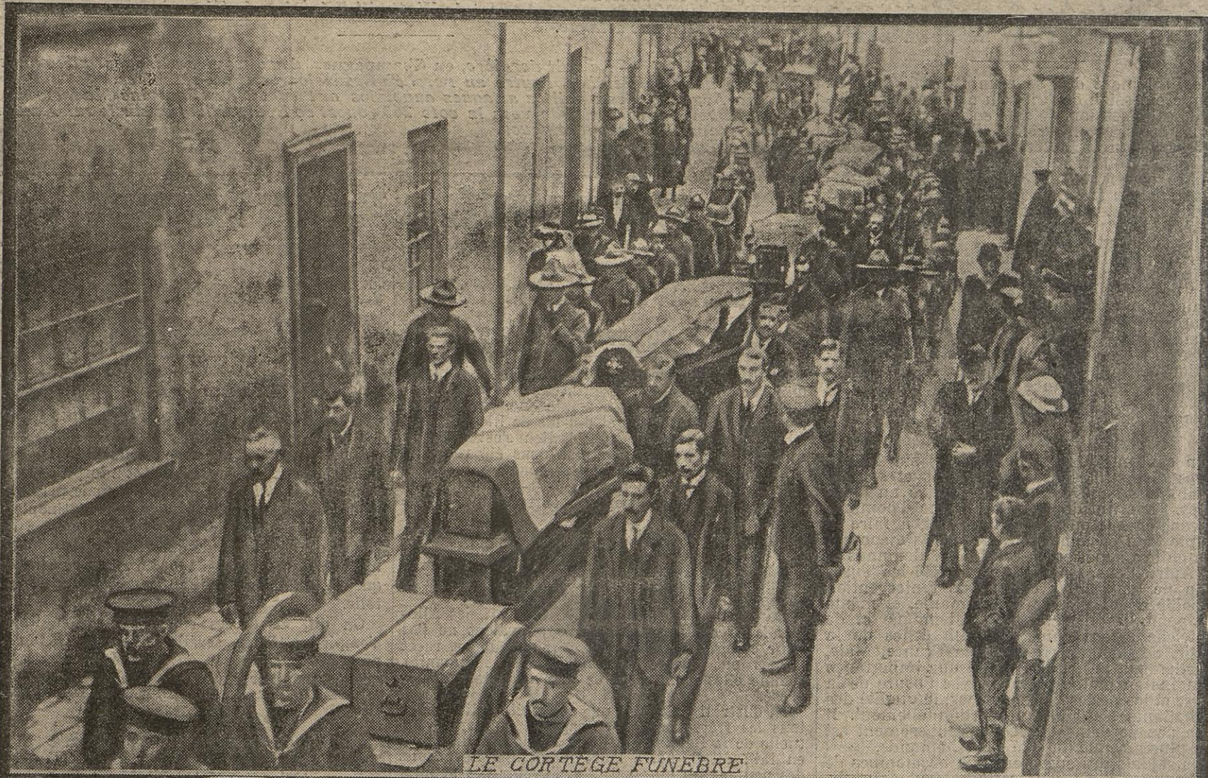
LE CORTEGE FUNEBRE