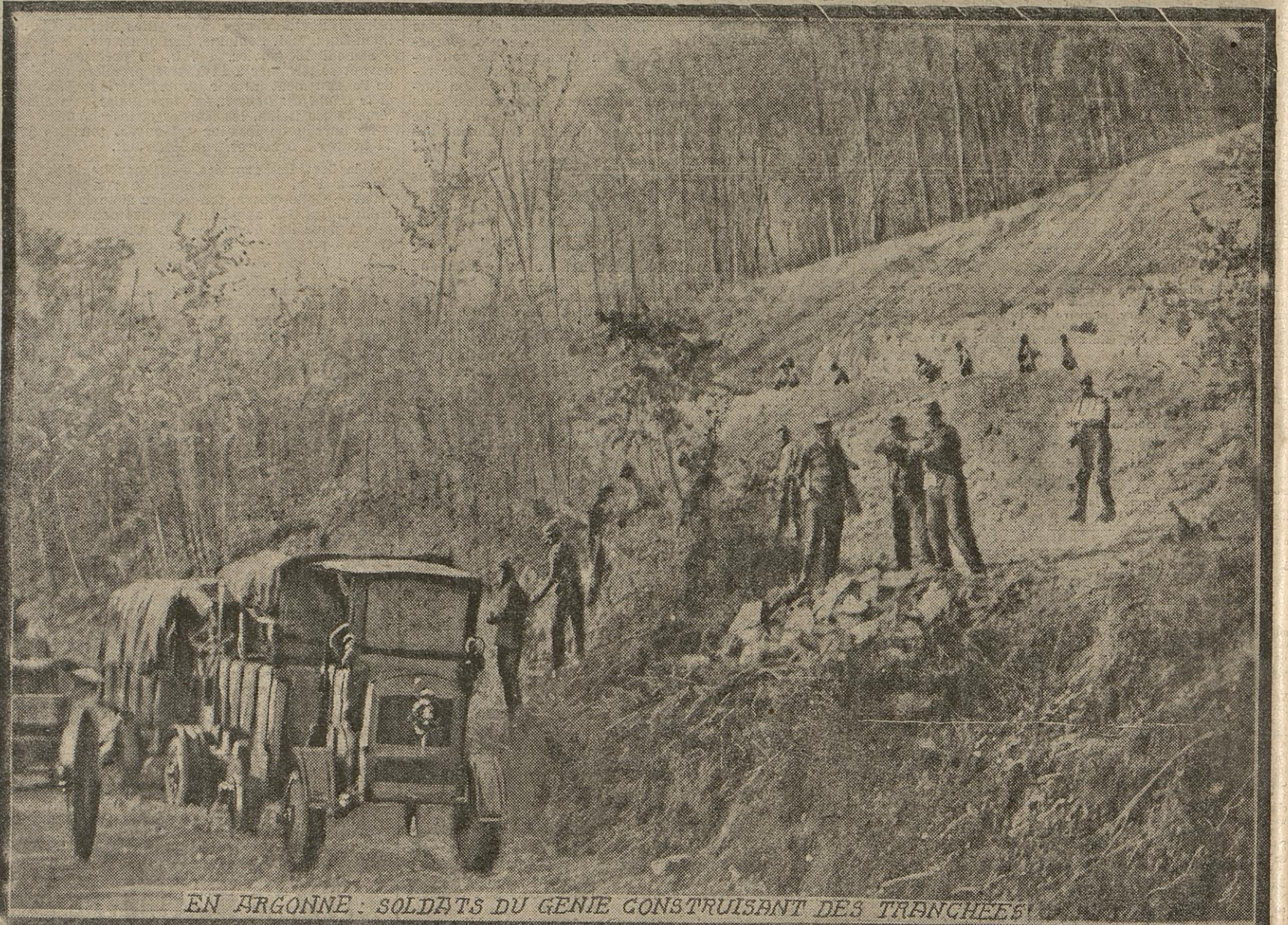
EN ARGONNE : SOLDATS DU GENIE CONSTRUISANT DES TRANCHEES