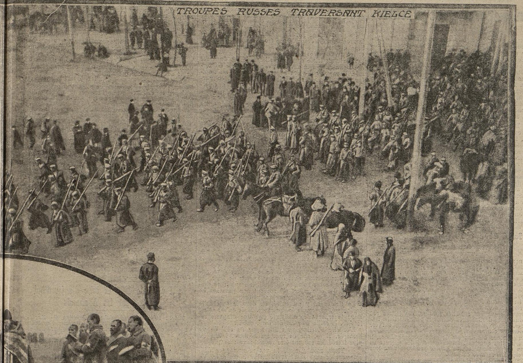
TROUPES RUSSES TRAVERSANT KIELCE