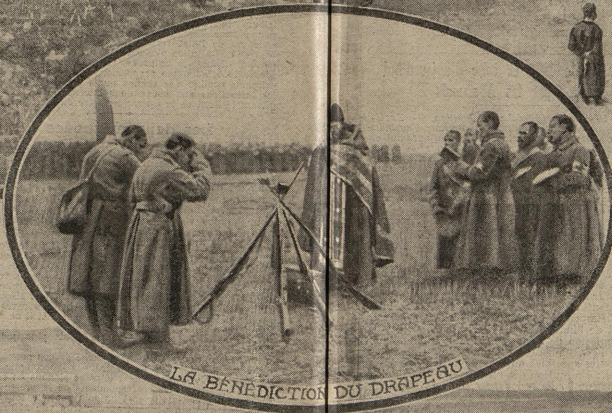
LA BENEDICTION DU DRAPEAU