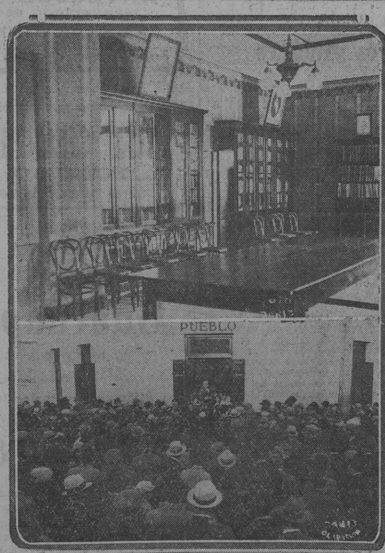
EL DOMINGO LLEVOSE A CABO LA INAUGURACION DE LA CASA del Pueblo de Olavarría. En la parte de ARRIBA del grabado se ve la amplia sala de lectura y conferencias de la sede oficial del socialismo de Olavarría. ABAJO, parte del público escuchando la conferencia del diputado Solari.

en las dependencias de la casa, que duró hasta pasadas las 21 horas. Es digno de hacer notar la gran afluencia de señoras y señoritas a este acto inaugural.