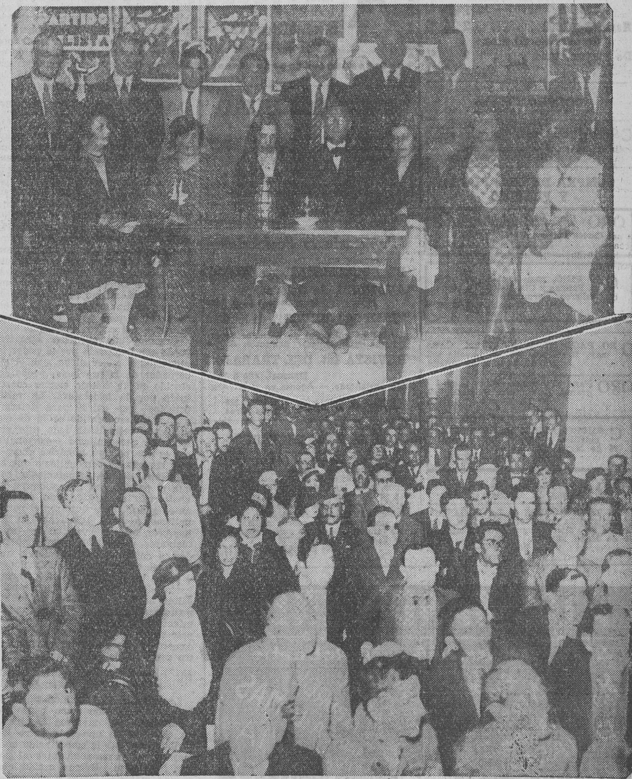
ASPECTO DEL SALON DE LA CASA DEL PUEBLO, DE ROSARIO, DURANTE LA CONFERENCIA pronunciada por el senador socialista de Córdoba, doctor Arturo Orgaz. — El orador rodeado de varias compañeras y afiliados