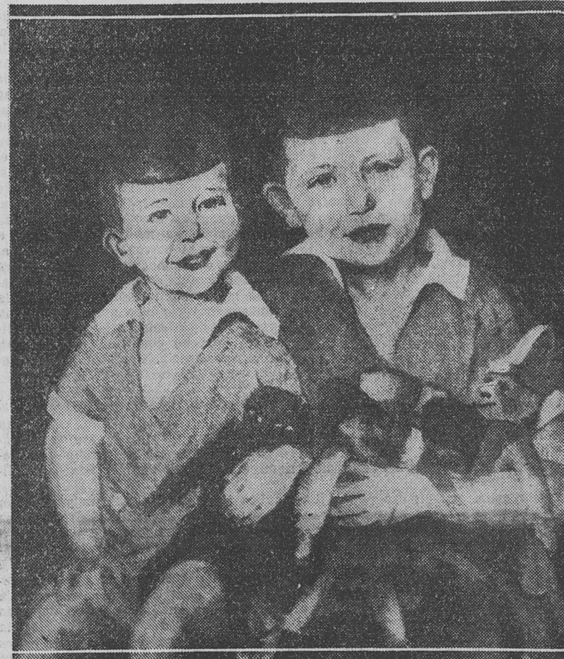
"DOS HERMANITOS", óleo por Helen Kirschke

posiciones tienden a la generalización, a la búsqueda de arquetipos, en los retratos; y en las obras de mayores proporciones y de más libre concepción, a la expresión de sentimientos amplios a cuya trascendencia se une la emoción en que aparecen envueltos. Así es co-