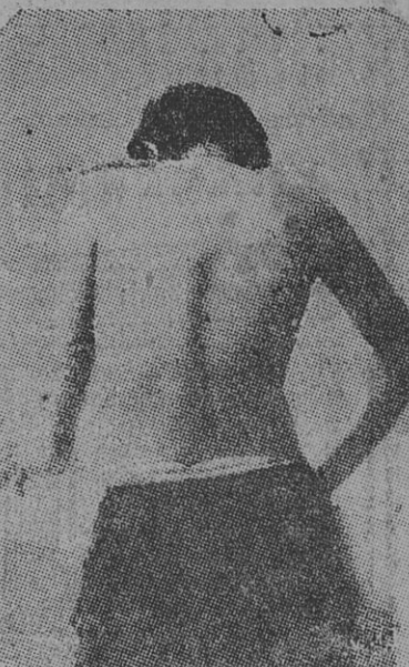
DEFORMACION CARACTERISTICA de la espina dorsal en los obreros cbanistas