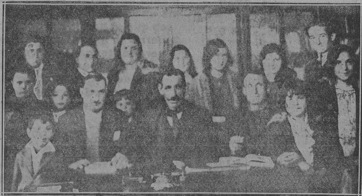
CENTRO SOCIALISTA DE BONIFACIO. VISTA TOMADA CON MOTIVO DEL ULTIMO FESTIVAL

Corresponsal Venado Tuerto. — No hemos recibido la comunicación a que hace referencia.