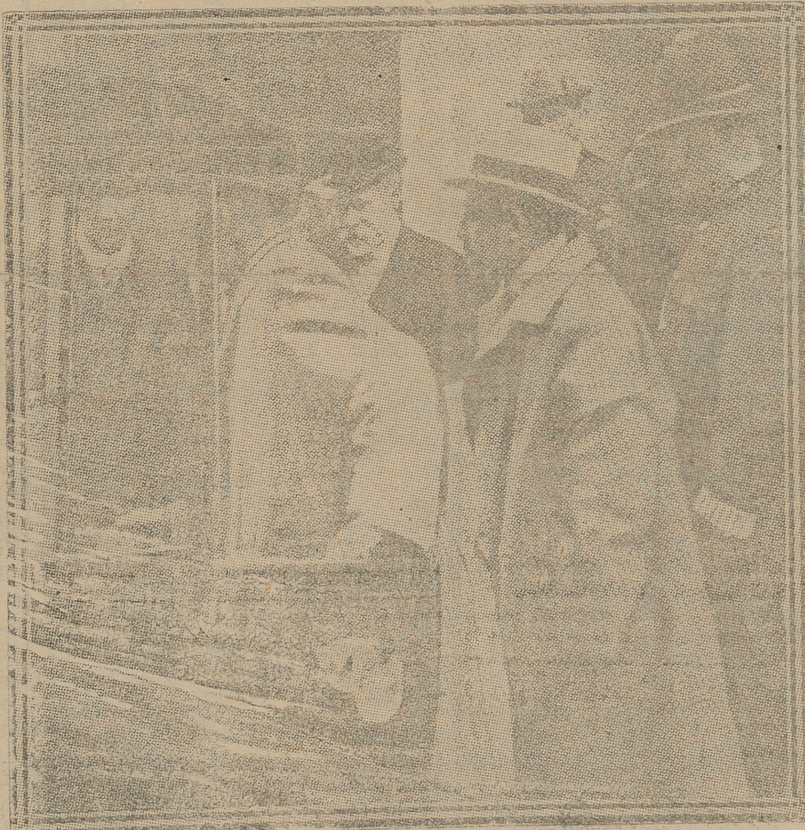
M. POINCARÉ QUITTANT DOWNING STREET

M. Poincaré termina en exprimant sa conviction que si un accord ne se réalise pas dans cette question où la France devrait avoir une voix prépondérante puisque sa créance représente plus de la moitié de la créance totale, il espère qu'on trouvera néanmoins naturel qu'elle cherche à sauvegarder ses finances et à se mettre à l'abri de la ruine.