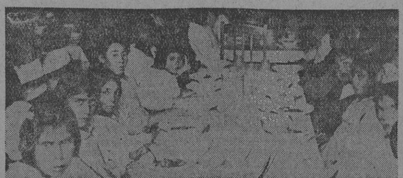
UNA VISTA DEL COMEDOR INFANTIL ESCOLAR, QUE SOSTIENE LA COMUNA SOCIALISTA DE SANTA ROSA, SERVICIO SOCIAL INAUGURADO RECIENTEMENTE POR LAS AUTORIDADES MUNICIPALES

toda consideración. — Secretario general".