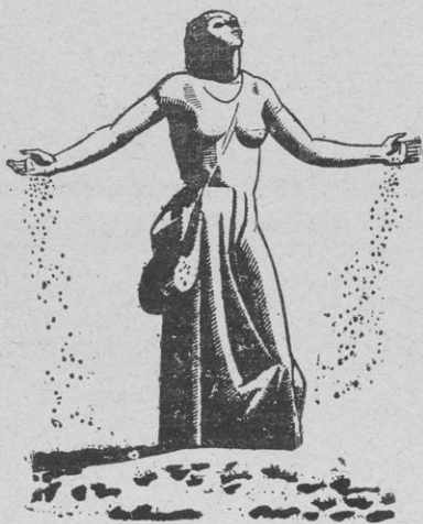
ARA I SEMPRE

Recollint les manifestacions fetes a París per un membre de la Convergència Democràtica de Catalunya adreçades a la reinstauració de la Generalitat, cal analitzar els orígens d'aquesta, el seu contingut històric i el que significà quan el Parlament català es desentengué de la República catalana sorgida de l'explosió popular del 12 d'abril del 1931.