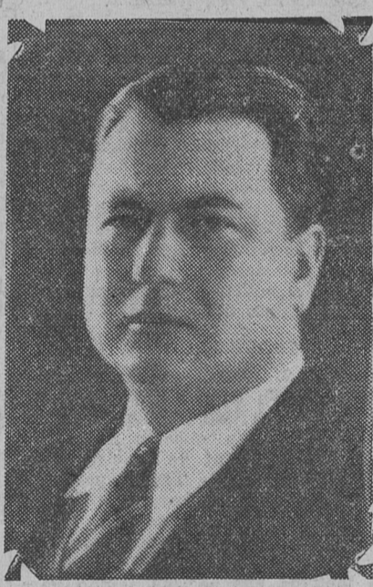
Candidato a diputado nacional por San Juan