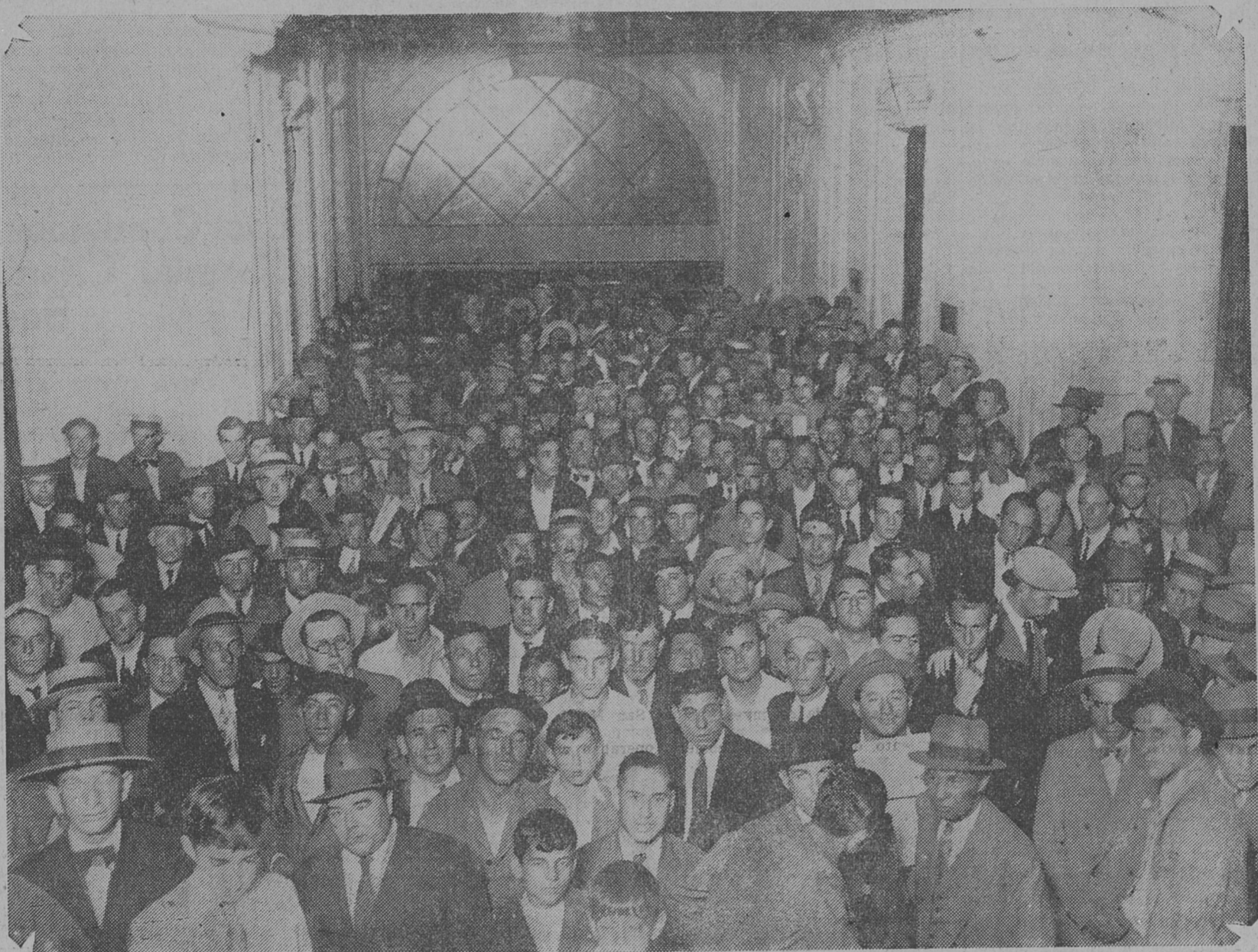
Una enorme y entusiasta concurrencia llenó ayer el "hall" y las dependencias de la Casa del Pueblo. La fotografía muestra a los ciudadanos, frente a la pizarra colocada en la escalinata, siguiendo los resultados del escrutinio.