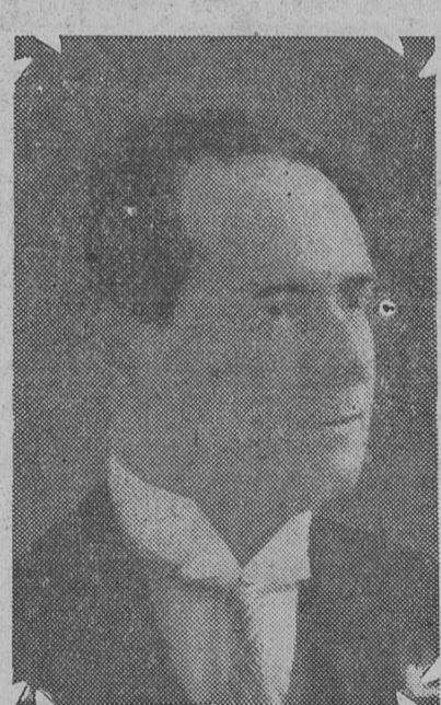
Integrante de la lista socialista, de candidatos, en San Juan.

de amenazas, me exigieron la entrega de los sobres para que el sufragio se emitiera a la vista y sin cuarto obscuro. También fui obligado a suprimir el acto de clausura. Como última medida de fuerza, se me hizo declarar, ante varios periodistas, que el acto había sido normal.”