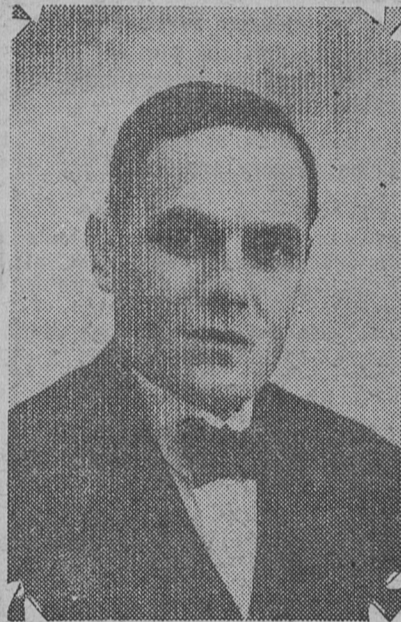
Candidato a la legislatura por el departamento San Jerónimo.