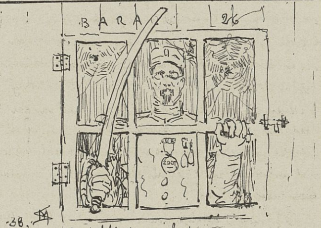
Blutschik in de barak