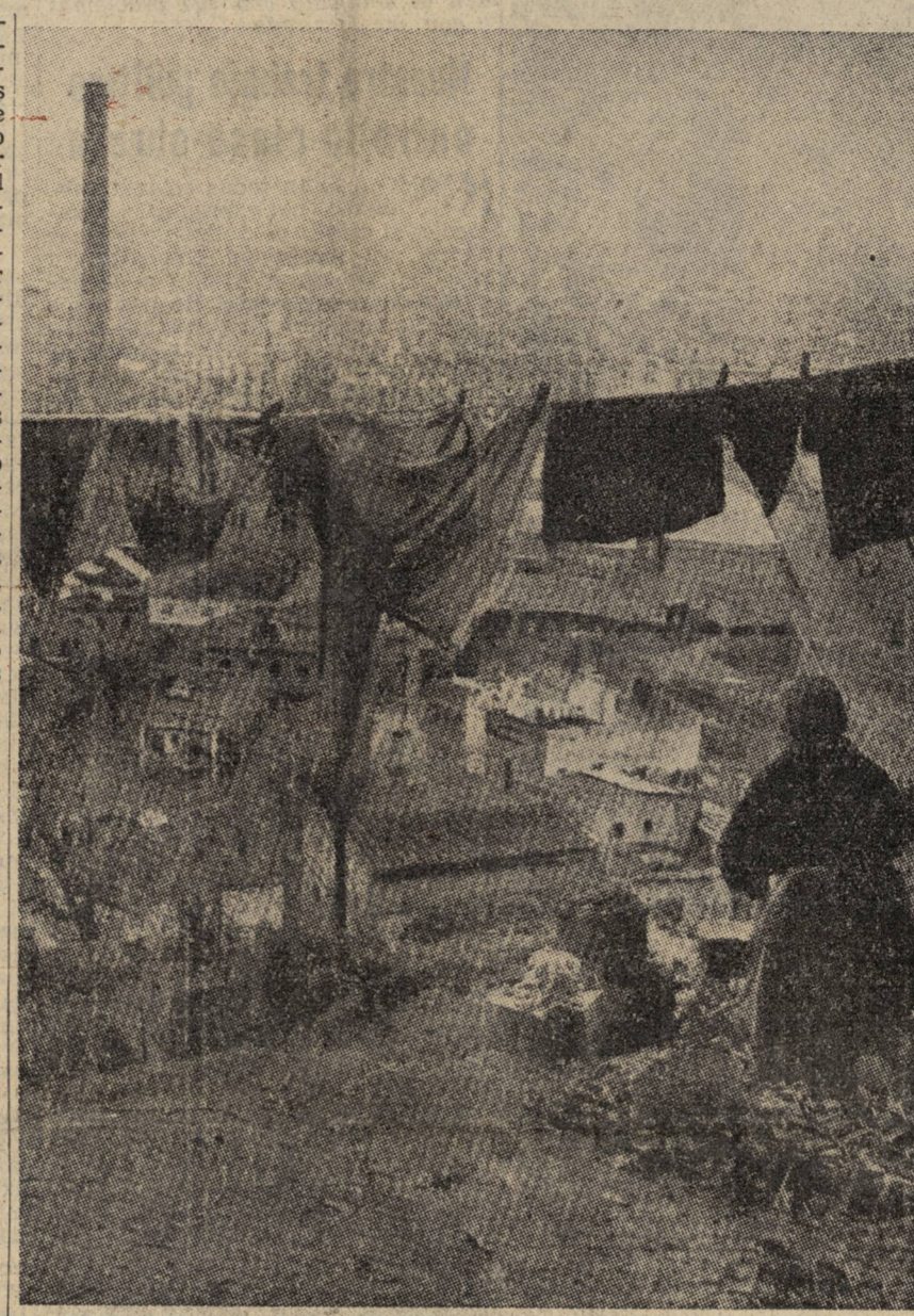
Esta fotografía tomada en Barcelona por un corresponsal norteamericano y reproducida por la Prensa gráfica de Estados Unidos refleja un aspecto del cruel contraste que ofrece la vida en España. En primer plano, una de las innumerables mujeres que padecen la espantosa miseria de los suburbios, a las puertas mismas de la gran ciudad donde unos cuantos nadan en la opulencia y en el lujo más insultantes para la mayoría que carece hasta de lo más elemental.

Contienen el ansia, común a todos los antifranquistas más conscientes y honrados, de luchar activa y firmemente por la paz, ya que saben que ese combate es el mismo que el combate por restituir a nuestra patria la República y la democracia la perdida libertad de marchar por el camino del progreso político, económico y social cerrado por Franco con la ayuda de los imperialistas promotores de guerra.