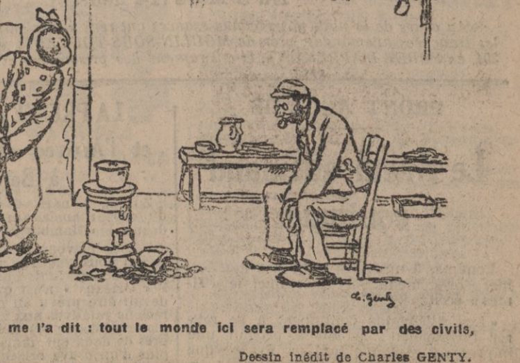
C'est l'infirmier qui me l'a dit : tout le monde ici sera remplacé par des civils, même les malades !