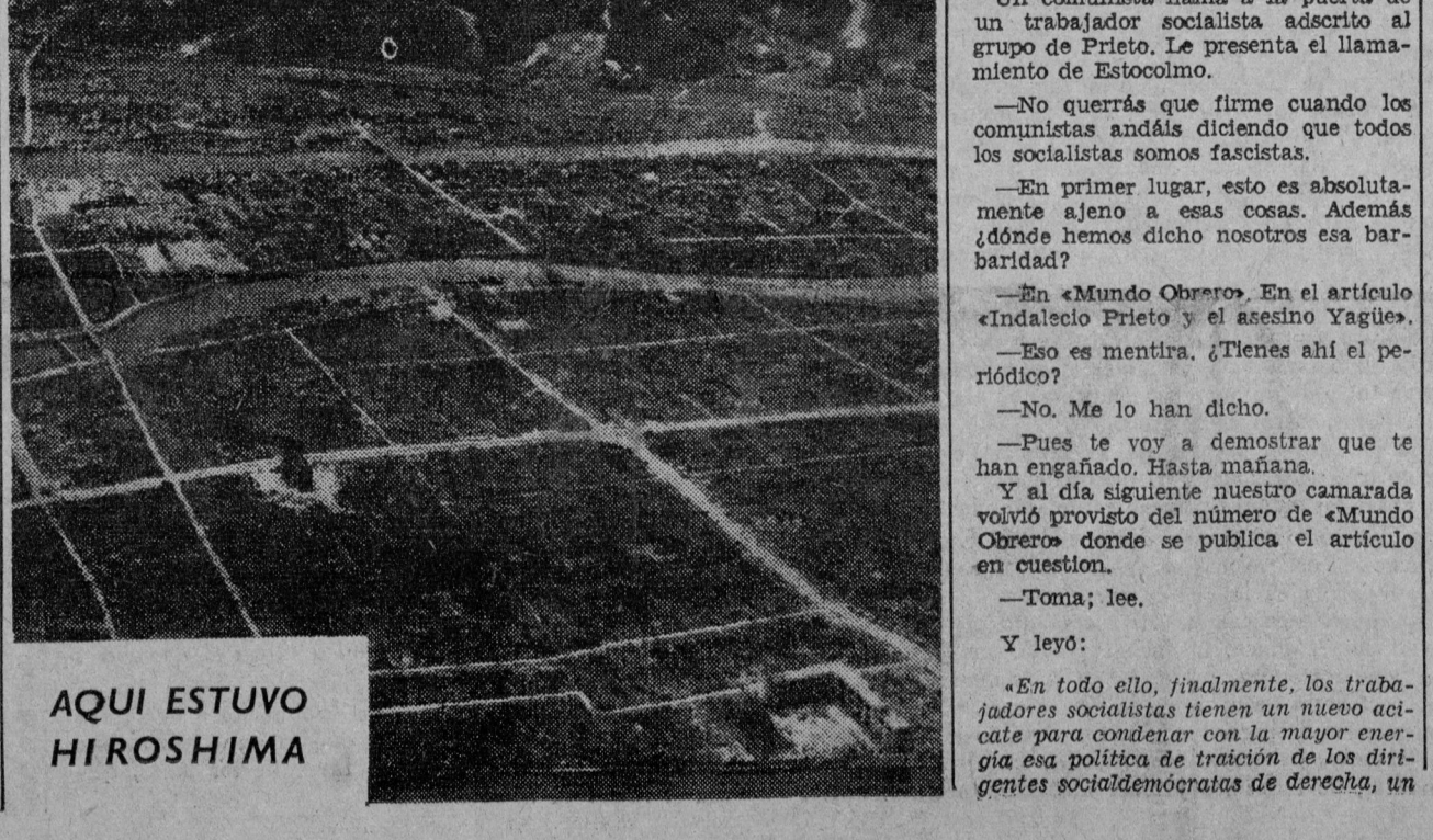
AQUI ESTUVO HIROSHIMA