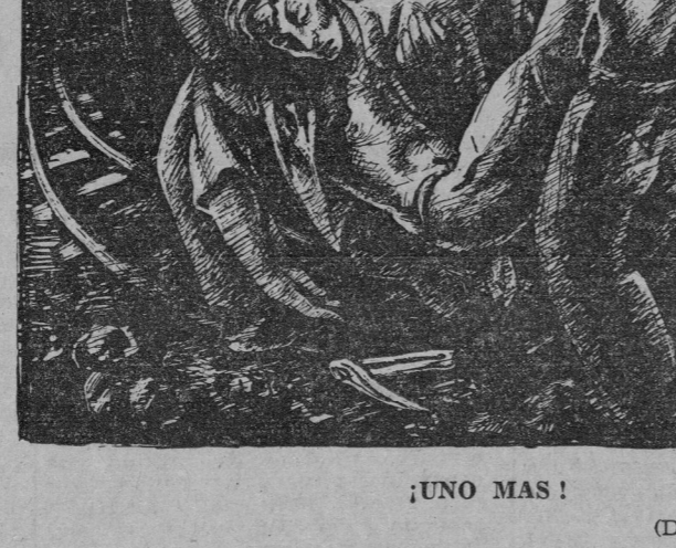
(Dibujo por Ceballos.)

El franquismo y los imperialistas saben que el principal y decisivo obstáculo que encuentran ante sí en su política de guerra es el Partido Comunista, alma y guía del movimiento unido del pueblo en defensa de la paz. Por ello roban los ataques contra el Partido y afilan las armas de la provocación contra él. Los esfuerzos de los franquistas, de los imperialistas yanquis y de sus viles servidores, los dirigentes socialistas de derecha y faístas, por minar el Partido, por hacer carne en él, son parte importantísima de la política encaminada a convertir a España en una base para la guerra que Wall Street prepara.