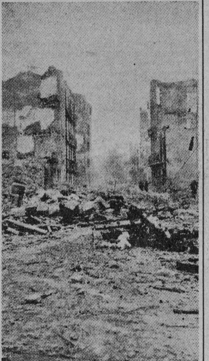
Lo que fué la destrucción de Guernica y otros pueblos y ciudades indica, aunque con pálido reflejo, lo que significarían para nuestro país los bombardeos atómicos incorporables más destructores. En la foto: Una calle de Guernica tras el criminal bombardeo nazi.

«Mundo Obrero» no decía eso.—El hijo firmó Un comunista llama a la puerta de un trabajador socialista adscrito al grupo de Prieto. Le presenta el llamamiento de Estocolmo. —No querrás que firme cuando los comunistas andáis diciendo que todos los socialistas somos fascistas. —En primer lugar, esto es absolutamente ajeno a esas cosas. Además ¿dónde hemos dicho nosotros esa barbaridad? —En «Mundo Obrero». En el artículo «Indalecio Prieto y el asesino Yagüe». —Eso es mentira. ¿Tienes ahí el periódico? —No. Me lo han dicho. —Pues te voy a demostrar que te han engañado. Hasta mañana. Y al día siguiente nuestro camarada volvió provisto del número de «Mundo Obrero» donde se publica el artículo en cuestión. —Toma; lee. Y leyó: «En todo ello, finalmente, los trabajadores socialistas tienen un nuevo acicate para condenar con la mayor energía esa política de traición de los dirigentes socialdemócratas de derecha, un