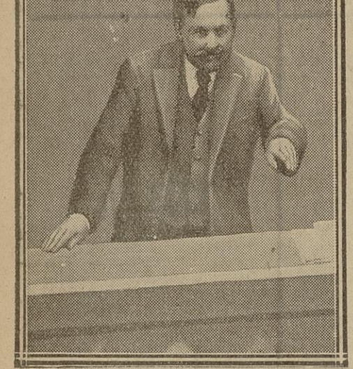
M. FRANKLIN-BOUILLON député de Seine-et-Oise, à la tribune du Palais-Bourbon

A la fin de la séance d'hier, on envisageait, d'ailleurs, pour lundi seulement l'intervention de M. René Viviani, président de la commission, et celle de M. Clemenceau. Le rapporteur général reprit hier la pa-