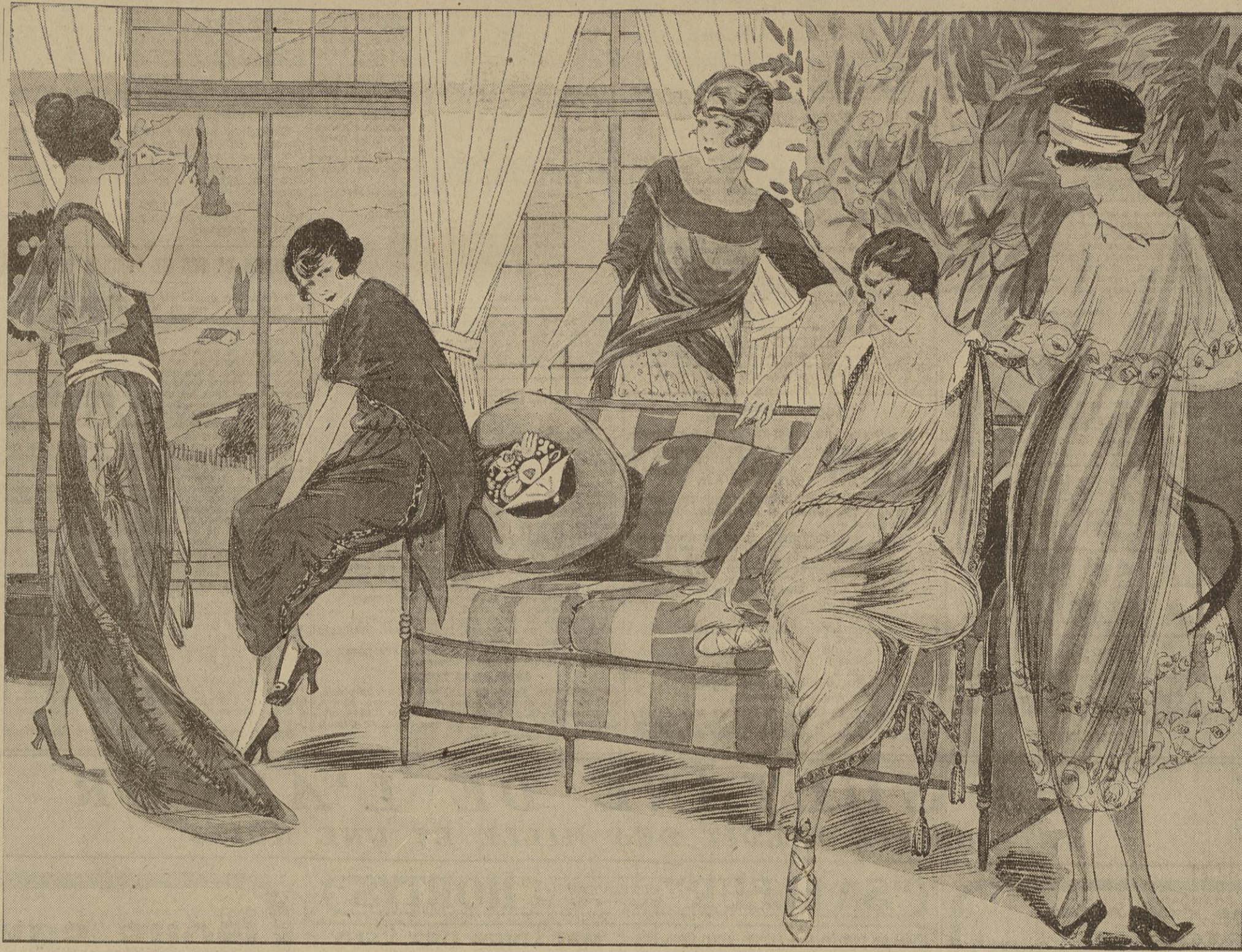
Tea-gown de crêpe marocain abricot brodé d'argent et mousseline du même ton. — WORTH. Déshabillé de satin glycine garni de broderie de nacre formant galon sur le côté. — JENNY. Robe d'intérieur en astaré par chemin et crépon brodé de bleu vif. — MARTIAL ET ARMAND. Robe grecque en crêpe satin rose garnie de galon et de glands de perles. — MARTIAL ET ARMAND. Robe de mousseline orchidée garnie de roses en gaze d'argent et de ruban. — WORTH.