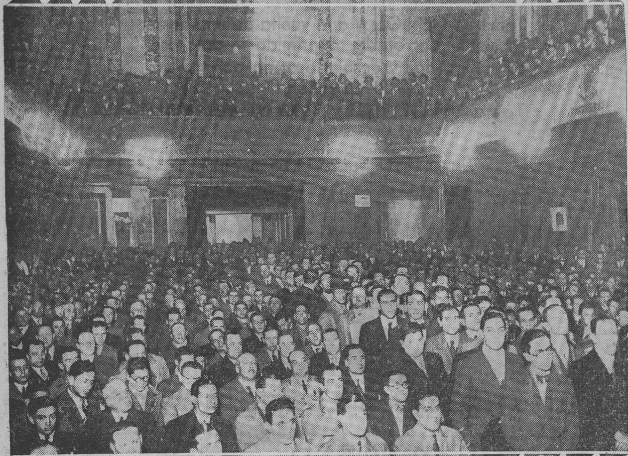
Una vista de la asamblea de los Empleados de Comercio

la trascendencia de esta reunión, informando a renglón seguido de las disposiciones adoptadas para el desarrollo normal de la misma a fin de que no se viera turbada por elementos patronales que pudieran infiltrarse con propósitos aviesos. Sobre el particular expresó que en el salón había una guardia autorizada para expulsar del mismo a los que no se comportaran debidamente.