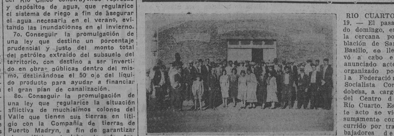
Grupo de afiliados y simpatizantes socialistas del Centro de San Basilio (Córdoba) reunidos frente al local de la conferencia