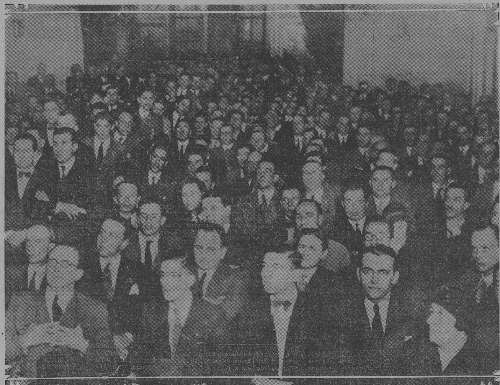
Aspecto que ofrecía el salón de la Casa del Pueblo, totalmente ocupado por los empleados que ayer se congregaron en él para protestar por el veto del poder ejecutivo

Y mientras el pueblo saborea el amargo de la realidad, desde las esferas oficiales surge de nuevo la palabra de esperanza que le hace reír su sueño. — Miguel Fernández. — Buenos Aires. 4-10-33.