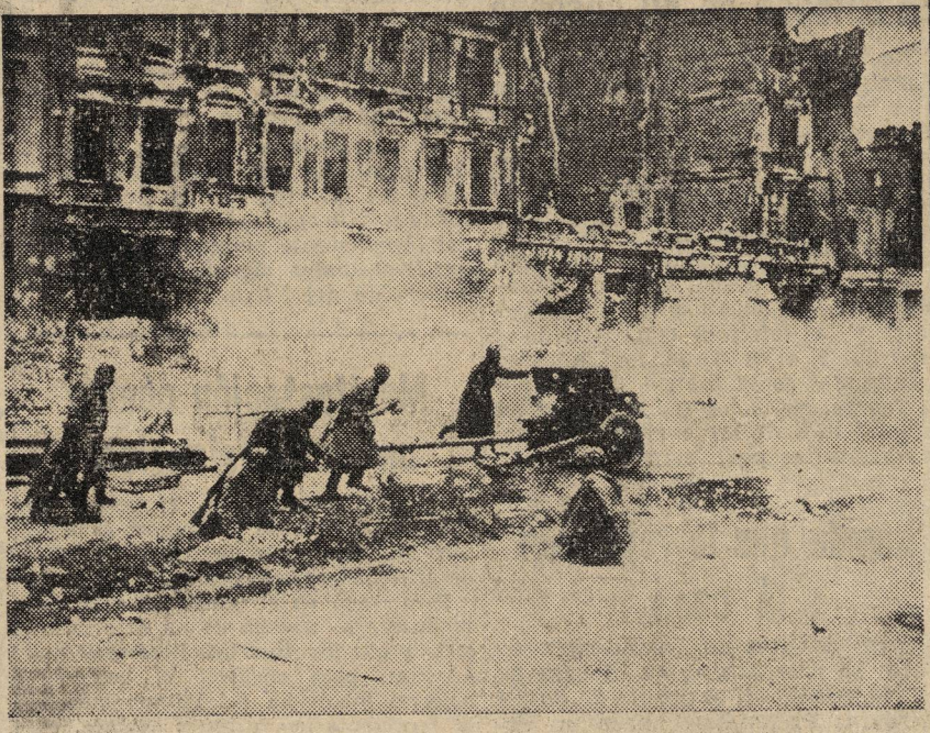
HACE CUATRO AÑOS. — Los combatientes soviéticos entrando en Berlín, reducen los últimos focos de resistencia hitlerianos.