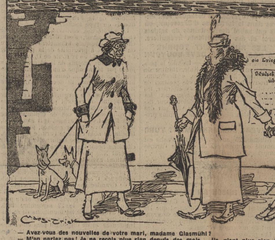
— Avez-vous des nouvelles de votre mari, madame Glamoullé ? — Non, mais pas de lui, ni de ses petits enfants depuis des mois... Il n'est plus rien à déménager.