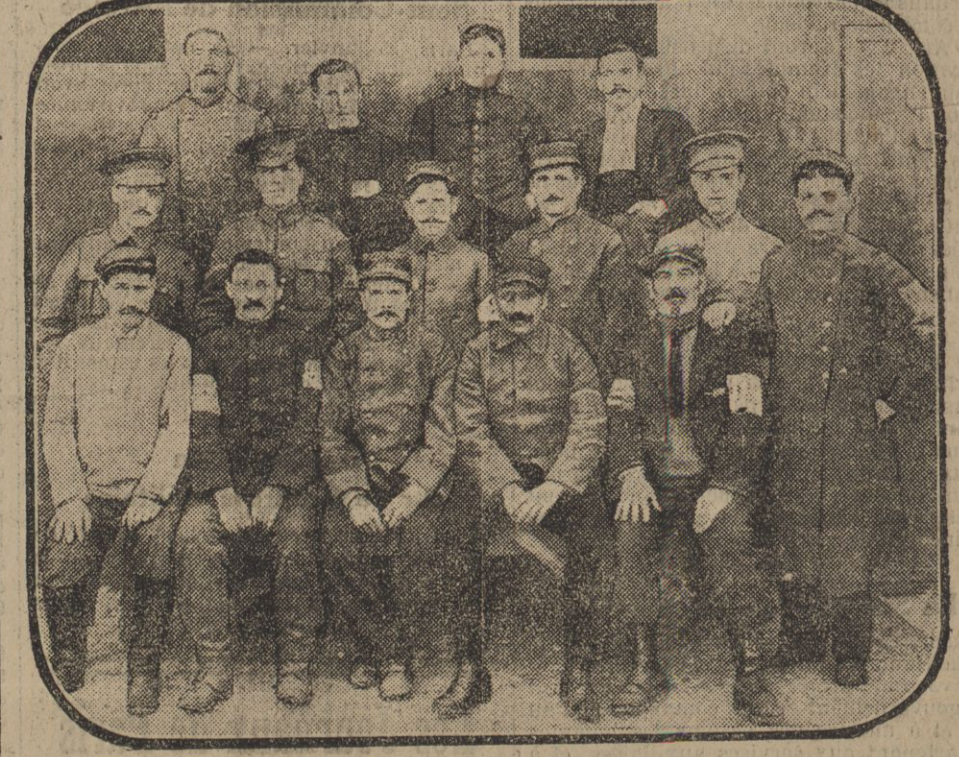
QUELQUES DÉTENUÉS AU CAMP D'HERPURT.