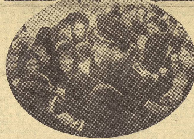
Miguel Primo de Rivera saludado por las familias.

de Colonización, a quien secundaron después con toda eficacia las organizaciones sindicales.