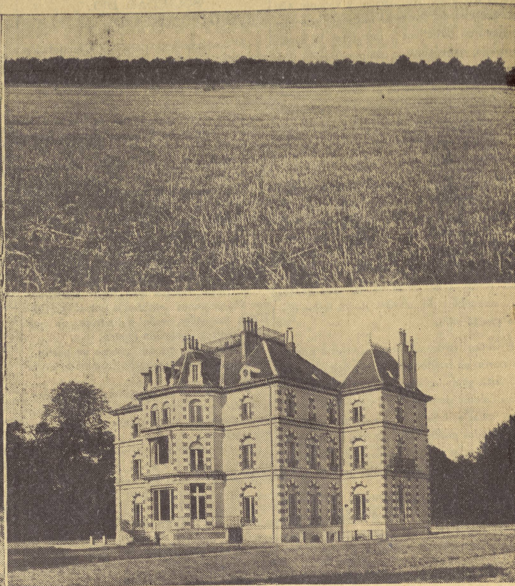
Vistas del Castillo de la Valette