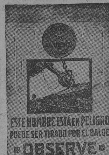
(Lámina de un trabajo del doctor Tiscornia)

Por respeto al D. del Trabajo, que ha levantado las infracciones; por respeto a las organizaciones obreras que contribuyen a las tareas de fiscalización; por respeto a las leyes que se