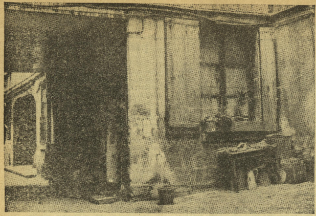
LE SIEGE DE LA PREMIERE INTERNATIONALE

Cette année tout ce qui se réclame du Mouvement ouvrier commémore le centenaire de la Première Internationale ou plus précisément de la Première Internationale ouvrière, si l'on veut compter comme organisations effectives les tentatives timides et sans lendemain de constituer une liaison internationale, plus jacobine que socialiste, de Mazzini en 1834, des Chartristes en 1846 et de Ledru-Rollin, Ruge et Mazzini en 1850. En réalité avant, la création de la Première Internationale ouvrière la seule tentative sérieuse fut celle des proscrits français, polonais et allemands auxquels une minorité des syndicalistes anglais s'était jointe et qui constituèrent à Londres, en 1856 « L'Internationale Association » qui disparut en 1859.