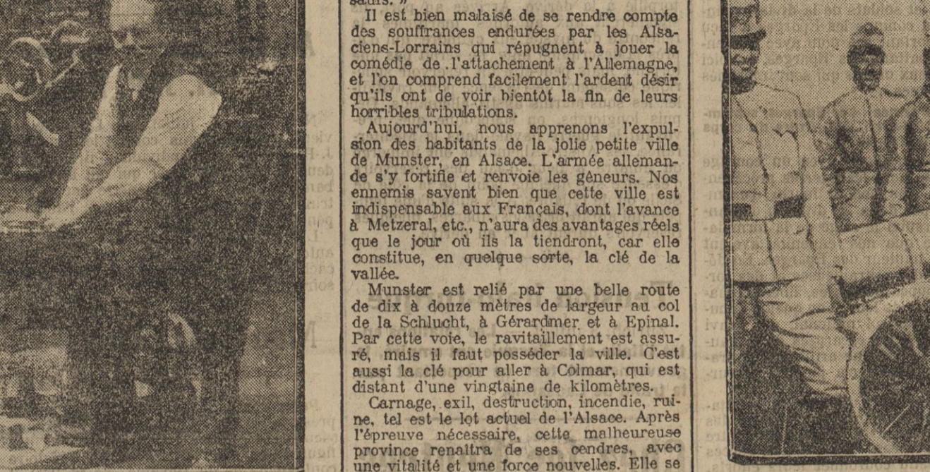
TYPES D'OBUS DONT LES AUTRICHIENS SE SERVENT EN GALICIE