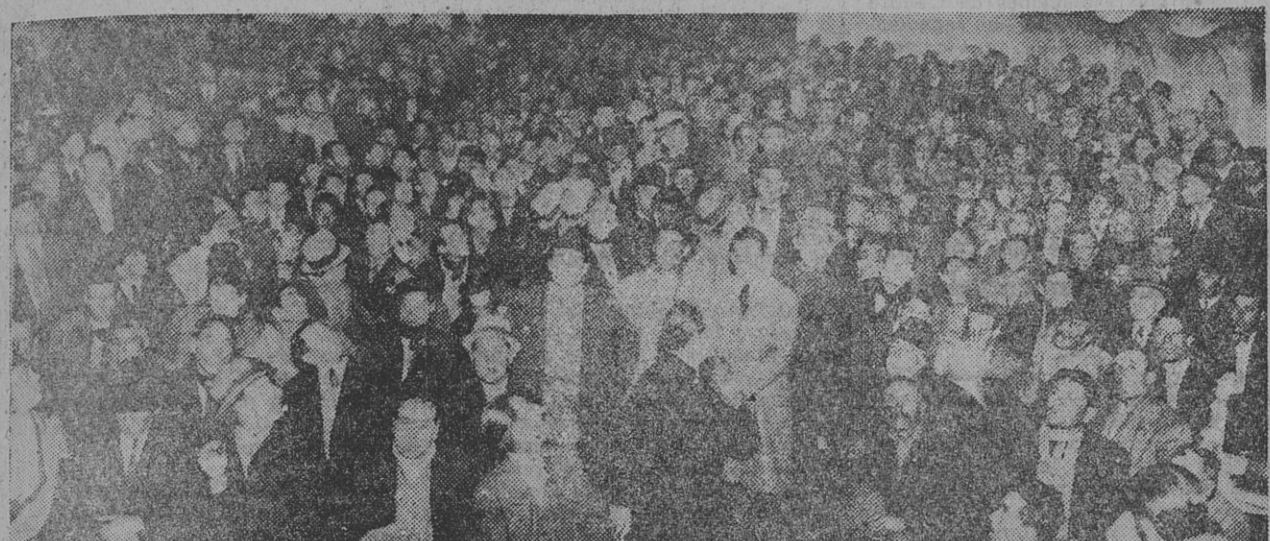
ASPECTO DEL SALON AL INICIARSE LA ASAMBLEA

— ausente Grosso — informó de la situación creada por la crisis de trabajo en que fundamenta las cesantías el M. de O. P., estado de cosas que se agrava por el elevado costo de la vida.