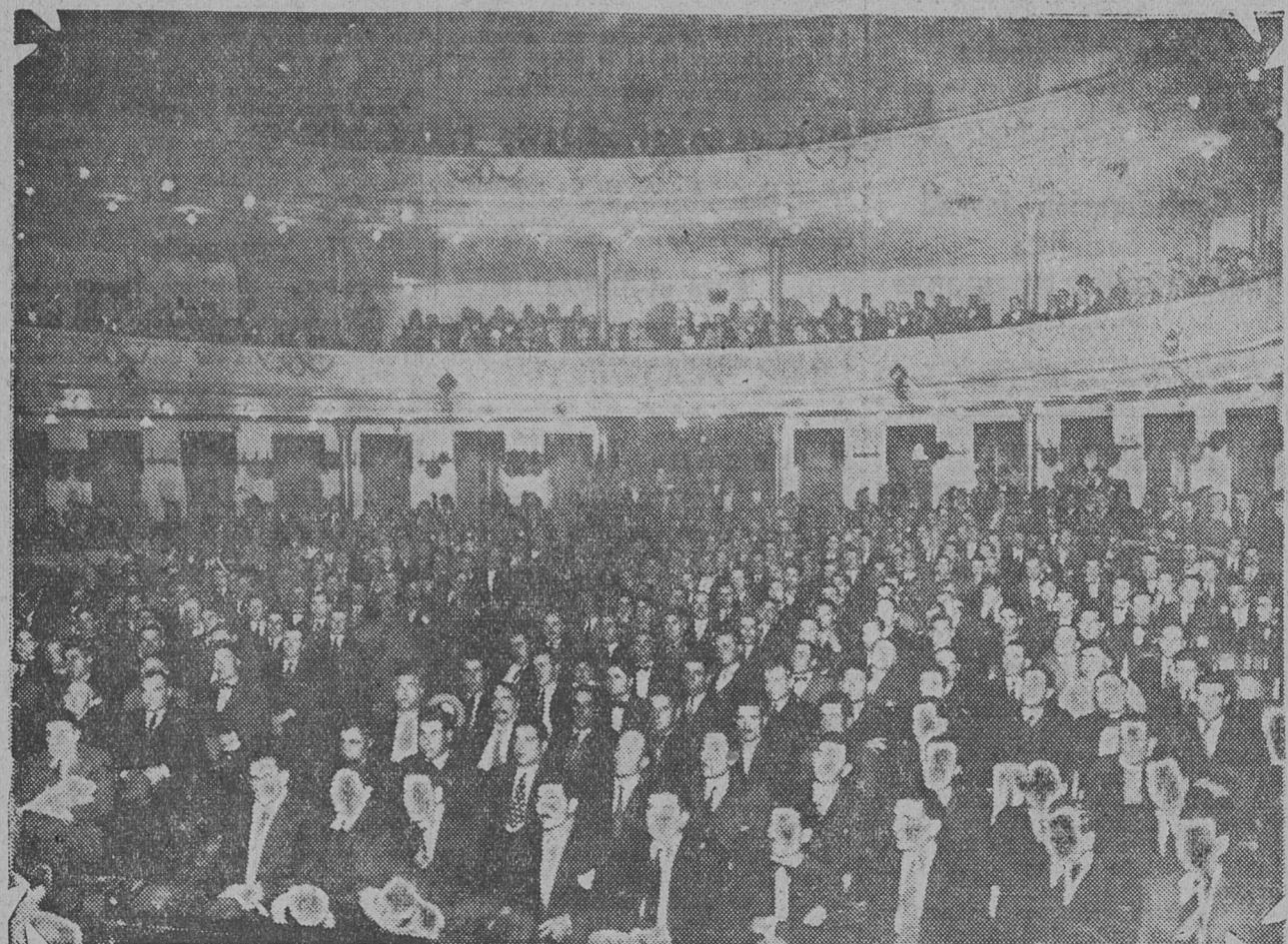
Aspecto que ofrecía la sala del Teatro Marconi durante el acto de los telefónicos