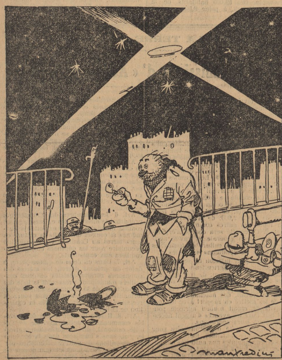
C'est une bombe incendiaire !... Ça m'a éteint la pipe...