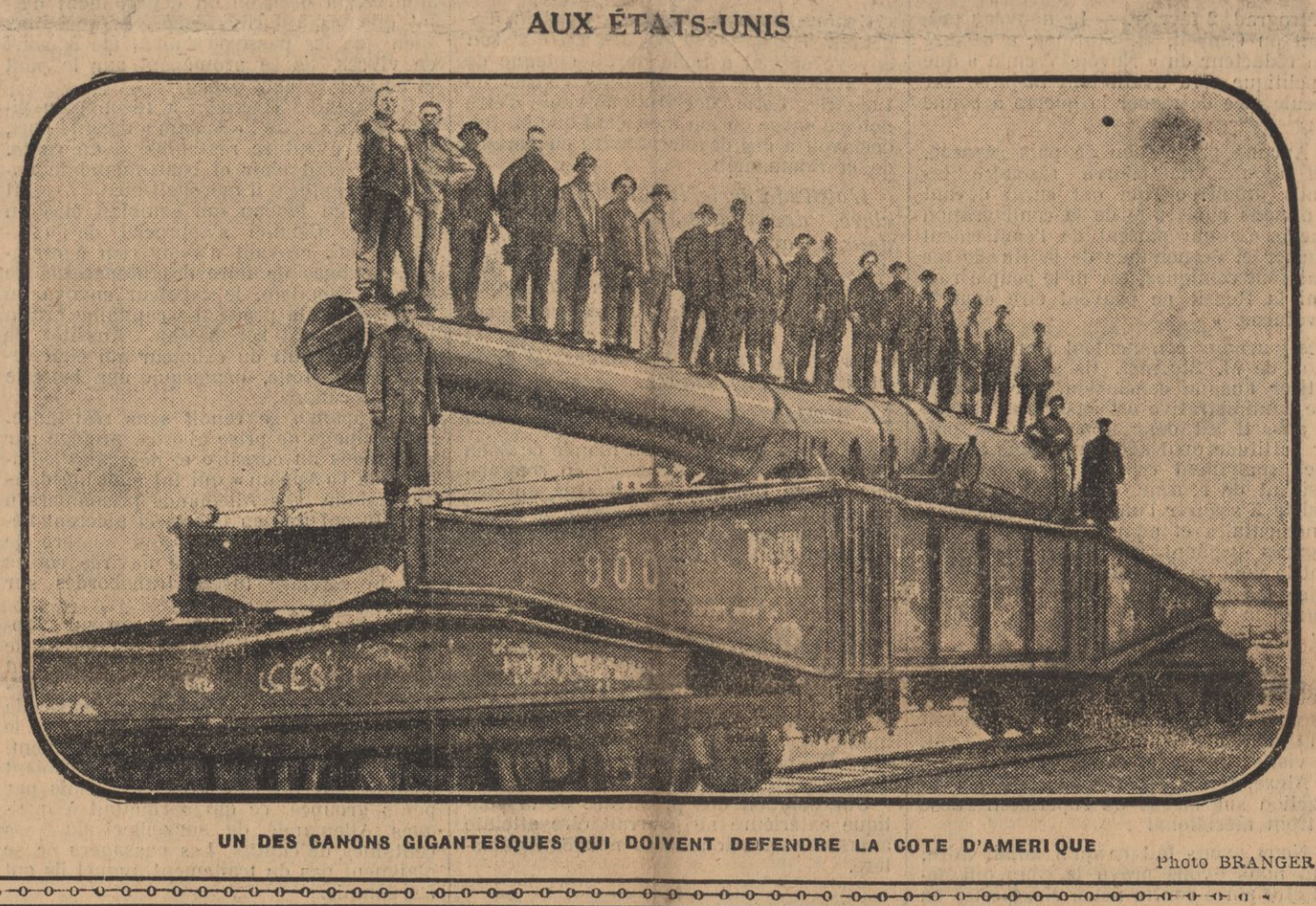
UN DES CANONS GIGANTESQUES QUI DOIVENT DEFENDRE LA COTE D'AMERIQUE

veillance la plus obséquieuse. A quoi bon rester à Salonique si nous devons tolérer plus longtemps cette