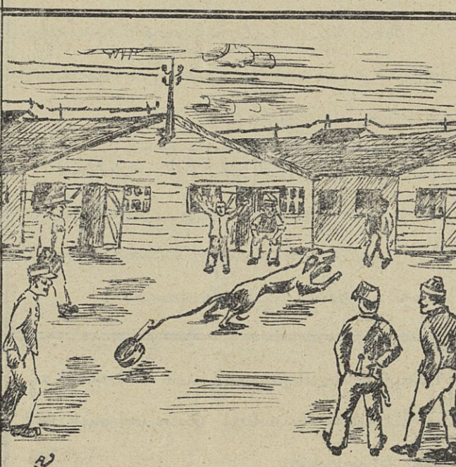
HAD JE ME MAAR

kameraden hem nog wel in hun midden terugzien ... Zulke helden daden zijn trouwen niet zeldzaam onder de Australiërs en die groote verlegen kinderen in 't gewone leven zijn allen helden op het slagveld