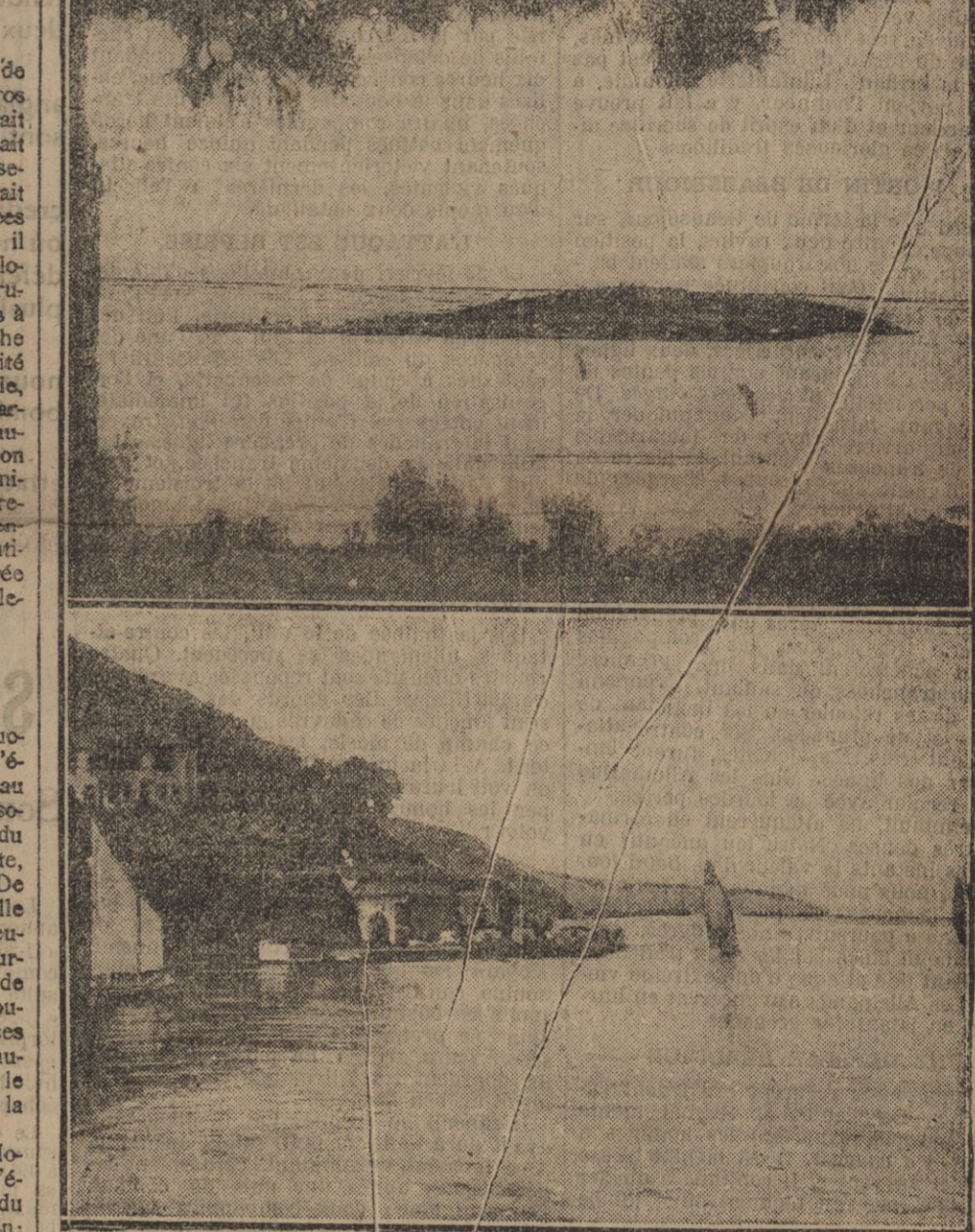
En haut: UNE DES ILES DES PRINCES dans le golfe d'Imid. En bas: VUE DE FRANKIYO, dans la mer de Marmara.