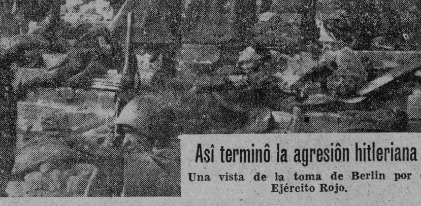
Así terminó la agresión hitleriana. Una vista de la toma de Berlín por el Ejército Rojo.

Todas y cada una de las caracterizaciones y previsiones hechas aquel día por el camarada Stalin demostraron su verdad, se cumplieron. Y todas y cada una tienen hoy, en nuevas condiciones históricas, una validez redoblada. Son tesoro de experiencia para todos los pueblos y terminante advertencia para los enemigos actuales de la U.R.S.S. y de los pueblos.