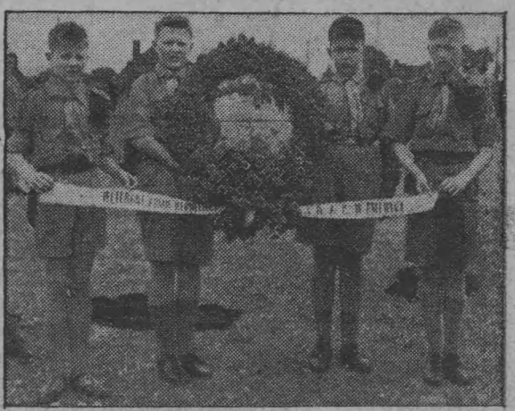
Harcerze z wieniec Stowarzyszenia Weteranów Armii Polskiej we Francji.