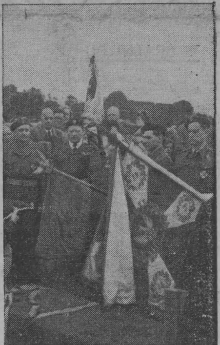
Sztandar 48 p. p. i 1 baonu saperów pochylone w hołdzie gen. Hallerowi.