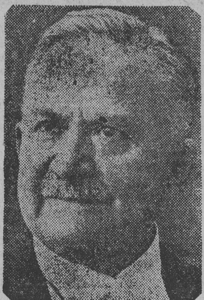
EX PRESIDENTE DE FRANCIA, que aceptó el encargo de formar gabinete.

fiscalización de 13.000 hombres de policía y del ejército. El público ignoraba la renuncia del gabinete.