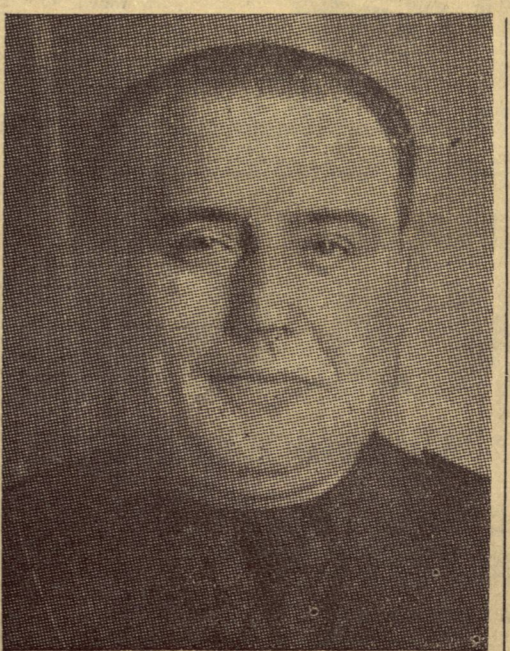
Don Eduardo Aunós

— Las relaciones económicas hispano-argentinas — respondió Aunós — se habían caracterizado hasta ahora por su irregularidad. No podíamos continuar con ese vaivén en nuestro porvenir económico. Nuestros países están hechos para compen-