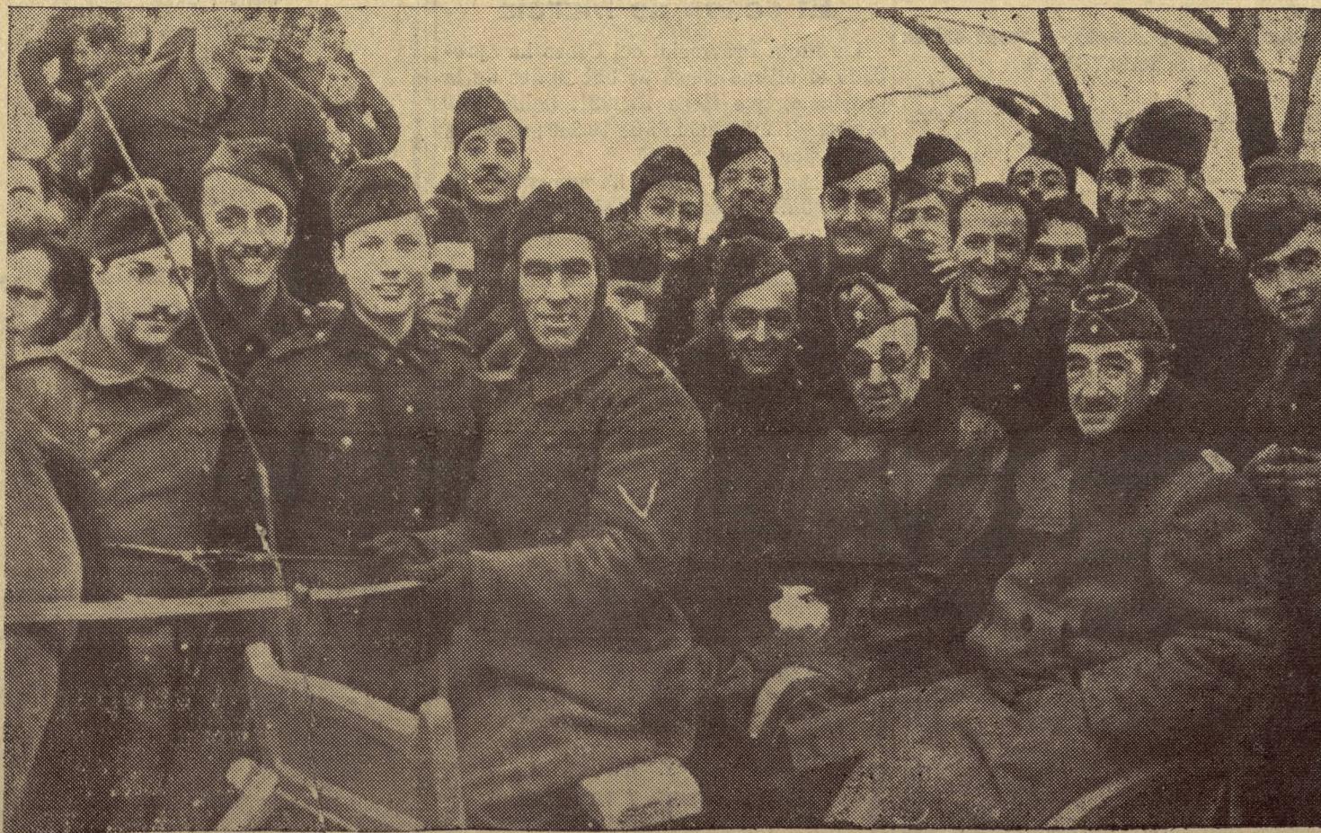
Fotografía inédita del General Moscardó con nuestros heroicos soldados de la División Azul, durante la visita que hizo al frente ruso