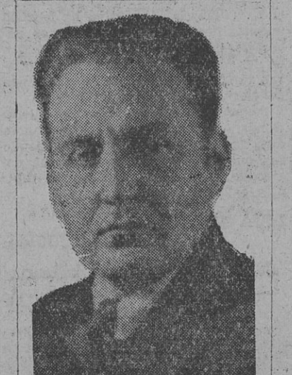
HAYA DE LA TORRE

libertad los presos políticos, inclusive Haya de la Torre.